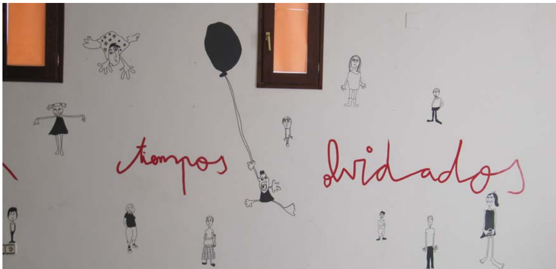
Detalle de la intervención en una de las paredes de la sala

En sus cuadros experimenta con diversos materiales y técnicas (acrílico, collage, lápiz, etc. ) y motivos abstractos. Destaca por la viveza de color así como por las referencias a las ideas reflejadas por Aguirre a través de la escritura de ciertas palabras. Según la propia artista sus cuadros se inscribirían en la abstracción lírica, donde es tan importante la pintura como la escritura. Su objetivo: transmitir sensaciones.