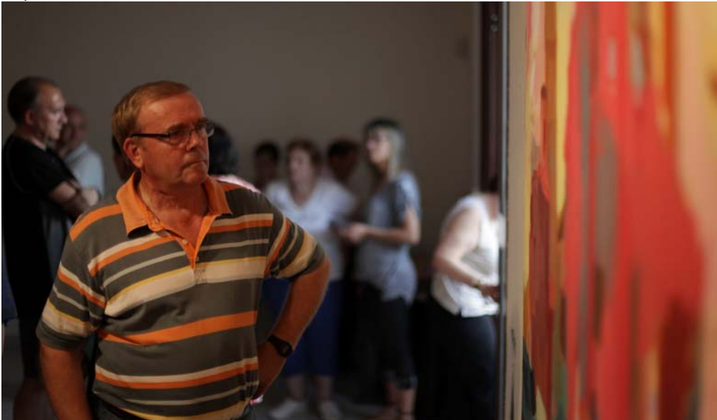
El público asistente