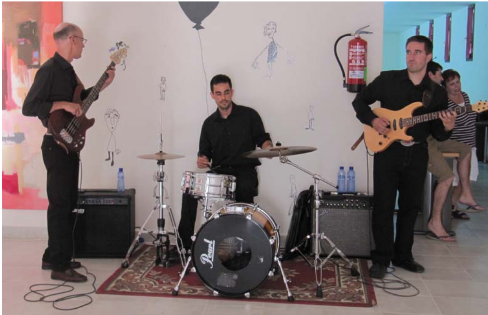
El grupo Magic Circus