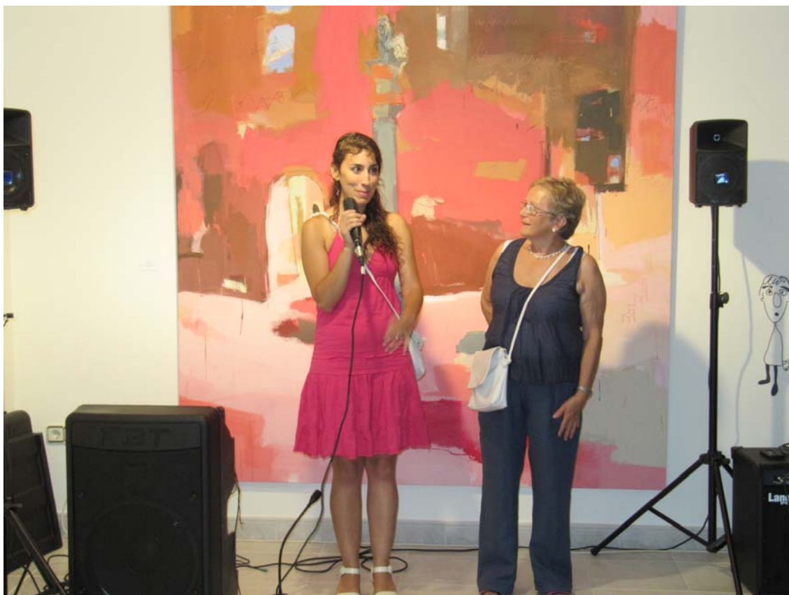
Marta explicando su obra acompañada por la alcaldesa de Crivillén