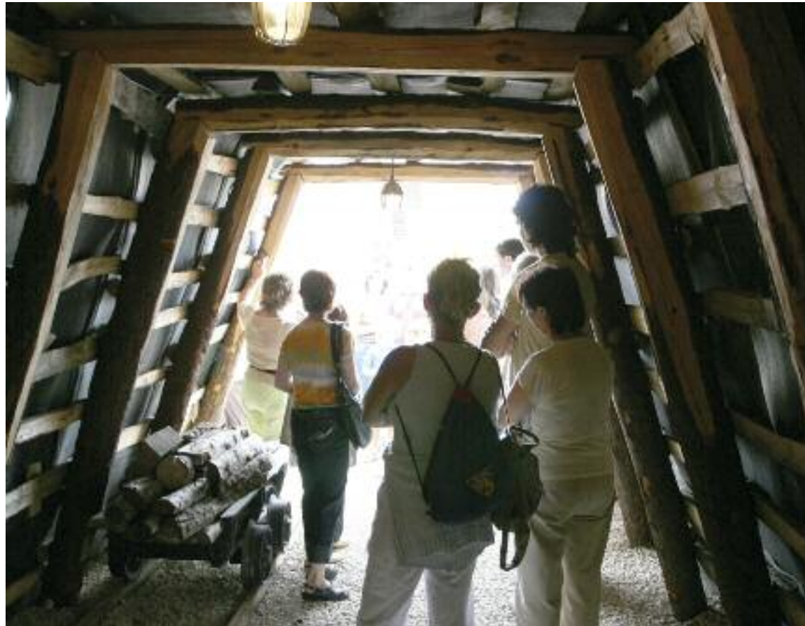
Uno de los espacios de Mwinas, el parque de la minería que hay en Andorra

En una tierra que ha vivido tantos años de la minería no se pueden dejar de lado las explotaciones a cielo abierto, sustitutas progresiva de las minas de interior. Es en el Espacio de Interpretación de la Restauración Ecológica de Zonas Mineras donde los visitantes se sumergen de lleno en este tipo de explotaciones.