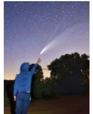
El cielo en Estercuel.

El GR 262 Río Martín discurre entre Las Parras de Martín y Albalate del Arzobispo, de forma que une tres comarcas de Teruel, Cuencas Mineras, Andorra-Sierra de Arcos y Bajo Martín. Se trata de un camino de casi 100 kilómetros que transcurre a orillas del río Martín y que permite a los senderistas conocer alguno de los rincones más bellos de estas comarcas.