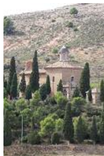
El Calvario de Alloza

en Estercuel. También habrá un recorrido por los Molinos de Gargallo o las calles entre las que se crió Pablo Serrano. Otros de los puntos de interés son el embalse de Cueva Foradada, la sima y el poblado íbero de San Pedro, en la localidad de Oliete. Todas estas visitas guiadas por Andorra Sierra de Arcos son gratuitas y parten a las 10 en punto desde la plaza de cada ayuntamiento en aquellos recorridos que discurren por los pueblos y a las 9 las que se realizan por el medio natural.