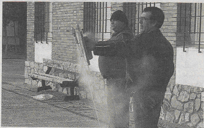
Dos miembros de la comisión disparaban ayer los cohetes anunciadores, A. C. M.