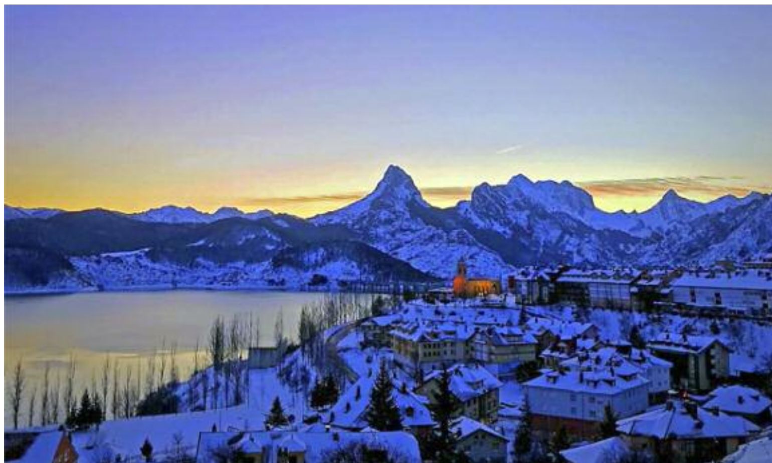
Parorámica de Riaño (León) al anochecer, con la iglesia de Santa Águeda destacada por su iluminación. Borja Barba