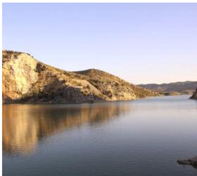
Embalse de Cueva Foradada. María Ángeles Tomás