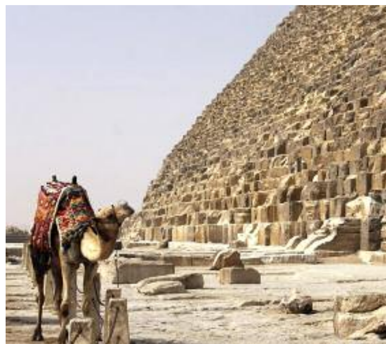
Fotografía de una de las pirámides de Egipto. Julio García-Araez