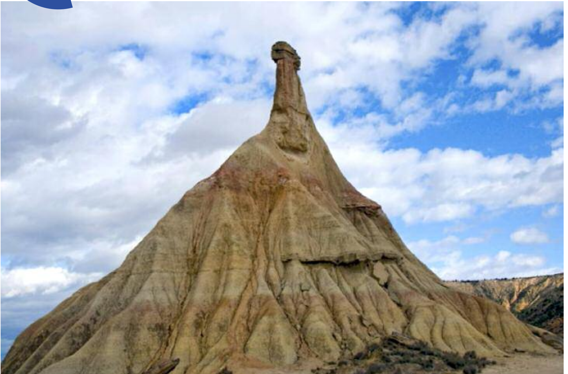
Castildetierra, imagen y símbolo del Parque Natural de las Bardenas Reales Rosa Pérez