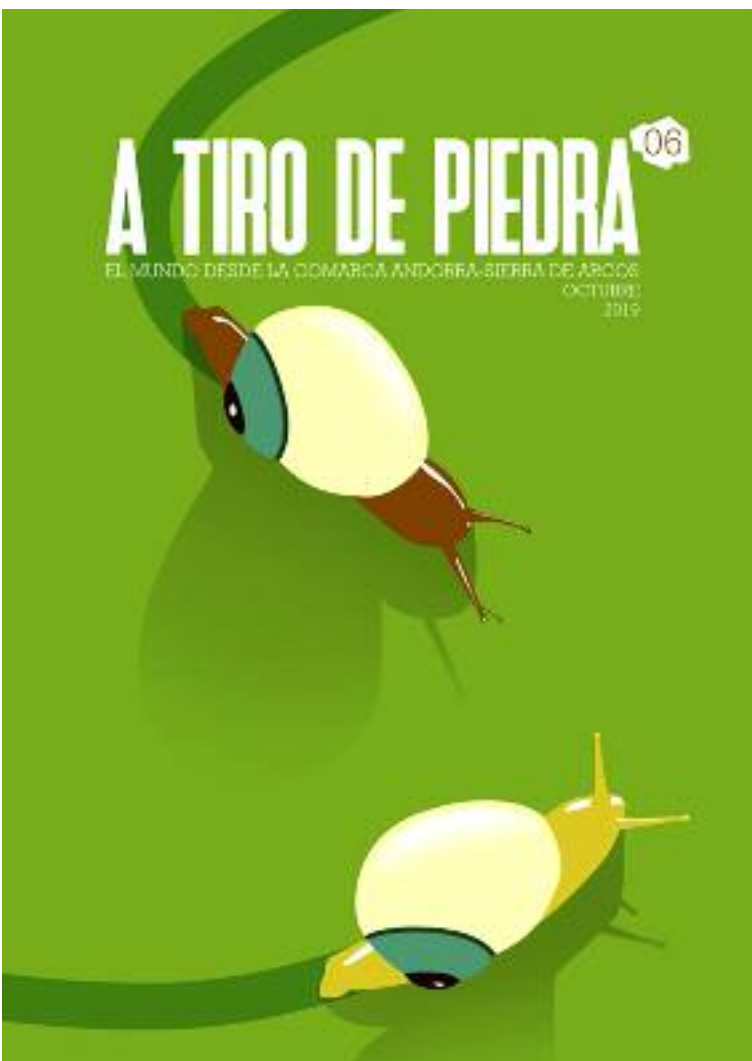
Portada del número 6 de 'A tiro de piedra', obra de Roberto Morote