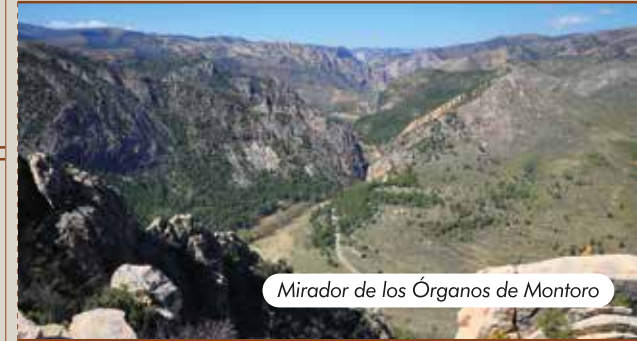
Mirador de los Órganos de Montoro

Se localiza en una pequeña elevación sobre los valles del río Esteruel y el Escuriza, justo sobre el lugar en el que ambos ríos se encuentran. Se puede llegar en vehículo desde el Monasterio del Olivar por una pista de unos 5 km en buen estado, tomando el primer desvío a la derecha del camino que va a Obón, o bien caminando siguiendo el trazado del PR-TE 93 desde el Monasterio en unos 50 minutos. La panorámica es sensacional: un extenso manto verde conformado por uno de los mejores bosques de coníferas de la comarca.