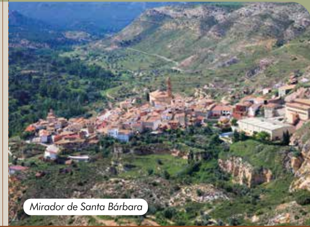
Mirador de Santa Bárbara

Frente a la ermita del mismo nombre se encuentra este mirador, muy próximo a la carretera A-1416. Tras tomar el desvío, bien señalizado, se llega en unos 200 metros de pista en buen estado. Crivillén y el valle del río Escuriza son los protagonistas absolutos de este mirador, uno de los favoritos de los buitres, que habitualmente a primera hora de la mañana están calentándose al sol sobre el tejado de la ermita.