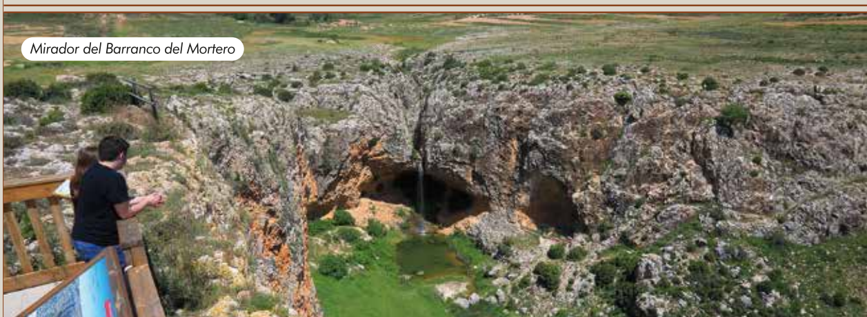
Mirador del Barranco del Mortero

Casi en el límite con la comarca vecina, también junto a la A-1702, se sitúa este mirador, popularmente conocido como el mirador de la cabra, pues es lugar de parada obligatoria en la carretera panorámica The Silent Route. Allí podemos hacernos un selfie con el logotipo de la ruta y contemplar el "sky line" del Alto Maestrazgo: un gigantesco retablo de montes, colinas, nubes, bosques y masadas que en las mañanas de invierno se completa con los campos de brumas que ascienden desde los valles.