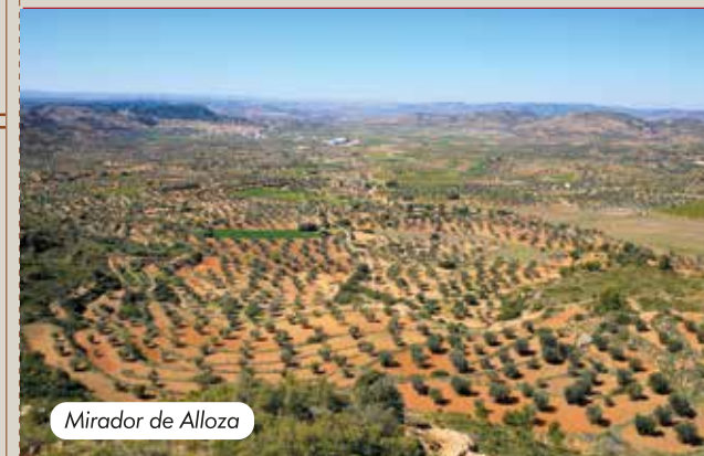
Mirador de Alloza