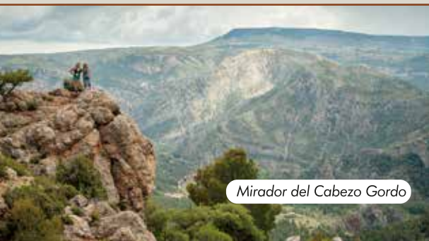
Mirador del Cabezo Gordo

Se accede por la misma pista que al mirador del Barranco de Cueva Muñoz, pero debemos continuar un par de kilómetros más, hasta una vez pasada la masía de los Barrancos, llegar a un desvío a la derecha donde está señalizado. Desde allí deberemos ir caminando en ligero ascenso hasta llegar al mirador, balcón extraordinario sobre los estrechos del Guadalope, el puente del Vao y las crestas del entorno de Villarluego.