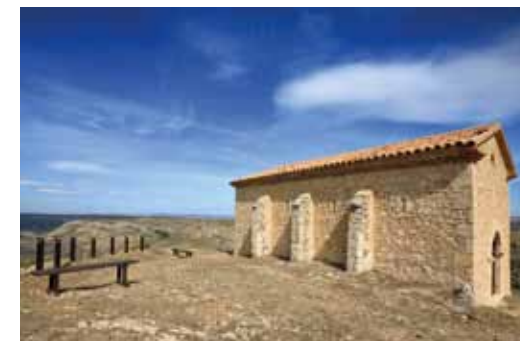
Mirador y ermita de Santa Bárbara. Foto: Antonio Delgado Abajo, panorámica desde el mirador de Alloza. Foto: ATO

De fácil acceso es también el mirador de Santa Ana , al que se llega desde la carretera A -1702 nada más pasar Ejulve. En sólo unos metros de pista llegamos a la ermita donde, además del mirador, hay un merendero. Frente a nosotros, Ejulve se desparrama al sol por la ladera de la colina y a sus pies se desliza suavemente, entre campos de cereales y pequeñas huertas, el Guadalopillo en su curso alto.