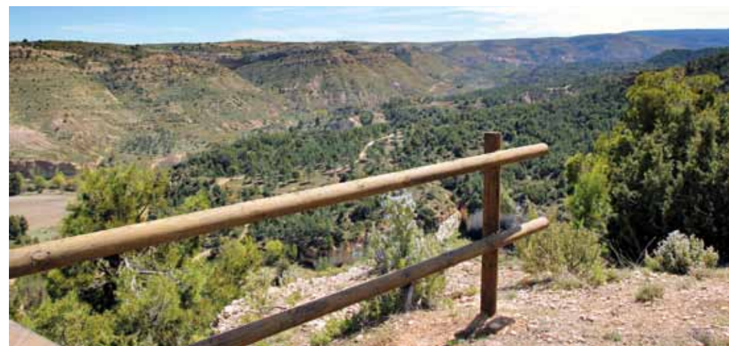
Mirador del Moncoscol hacia Crivillén.

La panorámica es sensacional: a nuestros pies se extiende un extenso manto verde conformado por uno de los mejores bosques de coníferas de la comarca, un pinar autóctono, maduro, de indudable interés natural, en el que se adivina el cauce del Escuriza enmarcado por una continua línea de chopos. Al fondo se distingue la sierra de Arcos y el congosto por el que el Escuriza se abre paso en su camino hacia su desembocadura en el Martín. En otoño, si cabe, la panorámica resulta incluso más cautivadora.