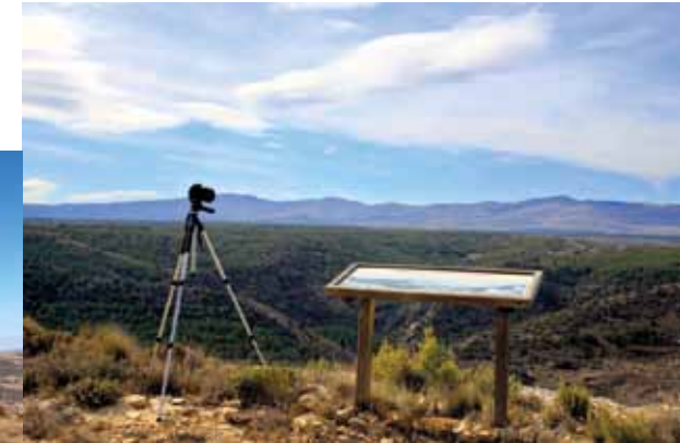
Arriba, mirador de Venta La Pintada. Centro-abajo, mirador accesible del barranco del Mortero, Alacón.