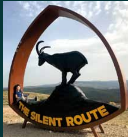
Arriba, logotipo de la ruta The Silent Route .

Sólo uno de los miradores se sitúa dentro de un casco urbano, el de Gargallo , marcando el inicio del sendero que conduce desde esta localidad hasta Crivillén siguiendo el valle del río Ecuriza. El mirador de la Venta de la Pintada , aunque sólo se sitúa a unos metros por encima del hotel del mismo nombre, junto a la carretera N-211, requiere un paseo de una media hora pues la pista de acceso no es adecuada para turismos. El pequeño esfuerzo merece la pena ante la mejor vista de la sierra de Majalinos.