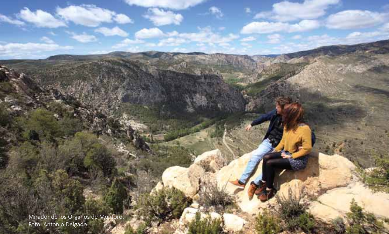
Mirador de los Órganos de Montoro.