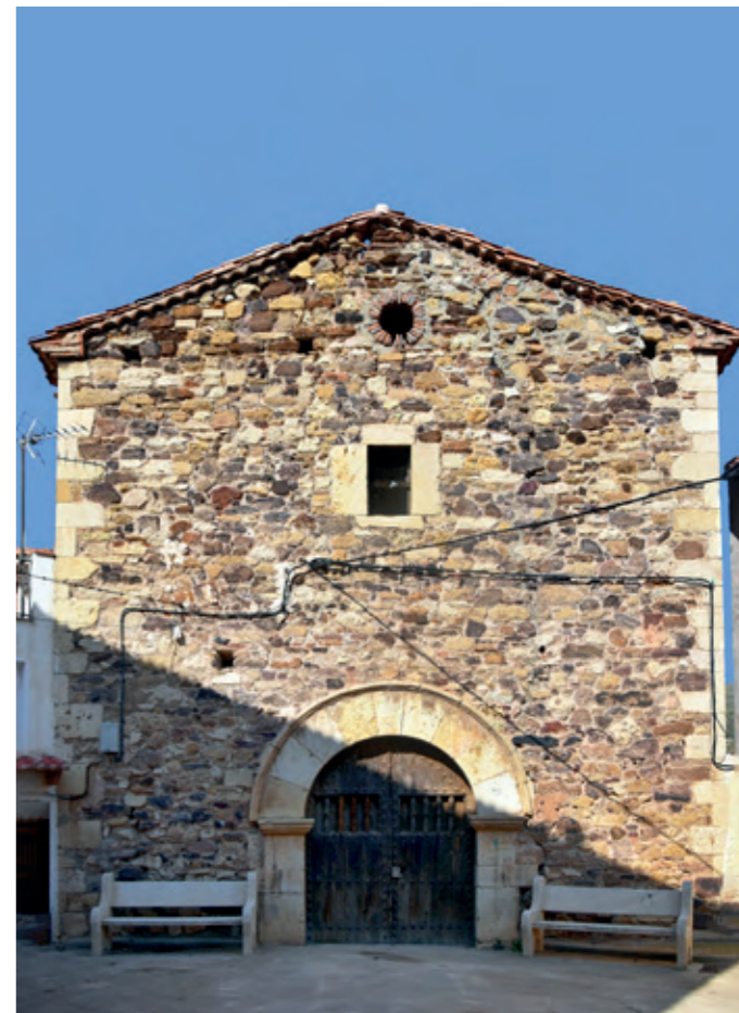
Ermita de Santo Toribio.