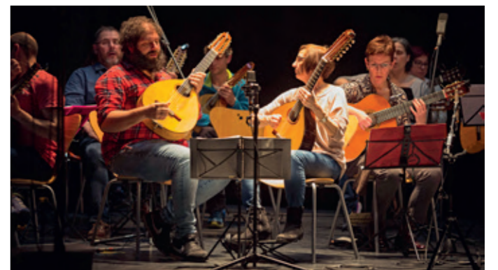
Agrupación Laudística de la Escuela de Música.