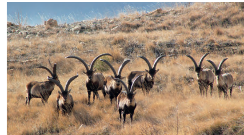
Grupo de machos posando para el fotógrafo.