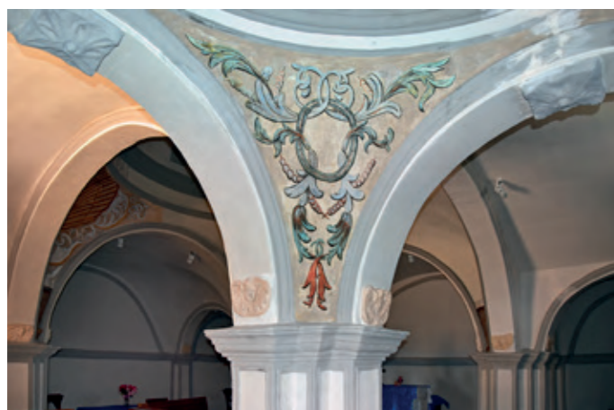
Pinturas al fresco en la ermita del Santo Sepulcro

con lunetos. Este tipo de distribución -una cruz griega inscrita en un cuadrado- es de tradición bizantina y recibe el nombre de quincunx (puede imaginarse como el número cinco de los dados). El modelo se aplicó por primera vez en la península ibérica en la iglesia de Santa Isabel de Portugal de Zaragoza en 1681. Una de las escasas ermitas que siguió este esquema (más frecuente en las iglesias) es la de Nuestra Señora del Pueyo de Belchite, concluida por el arquitecto Juan Faure, quien había construido asimismo la nueva iglesia parroquial de Estercuel; cabe la posibilidad de que diseñara esta del Santo Sepulcro, lo que explicaría que este modelo llegara a un lugar alejado de los centros artísticos.