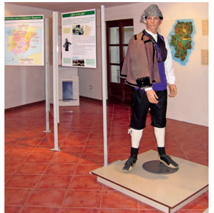
Centro Pastor de Andorra.