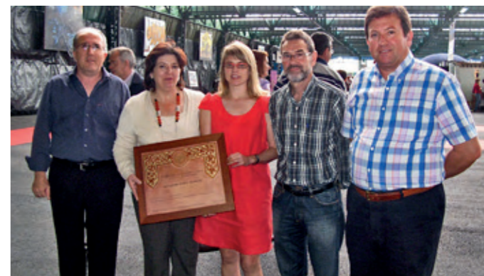
Miembros de la junta directiva y la técnico de la Comarca recogieron en Peñarroya el premio Santa Bárbara otorgado al MWINAS por el Colegio de Ingenieros de Minas de Córdoba (2009).