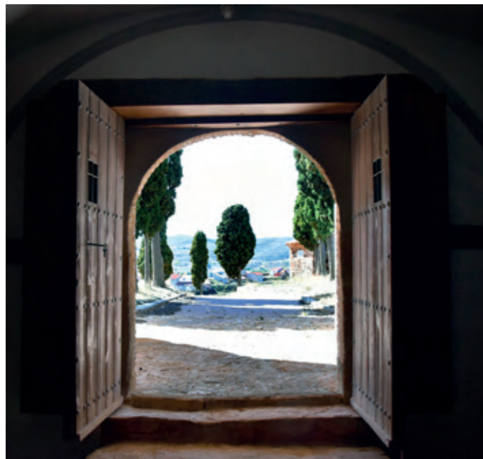
Ermita del Santo Sepulcro.

Josefina Lerma Loscos