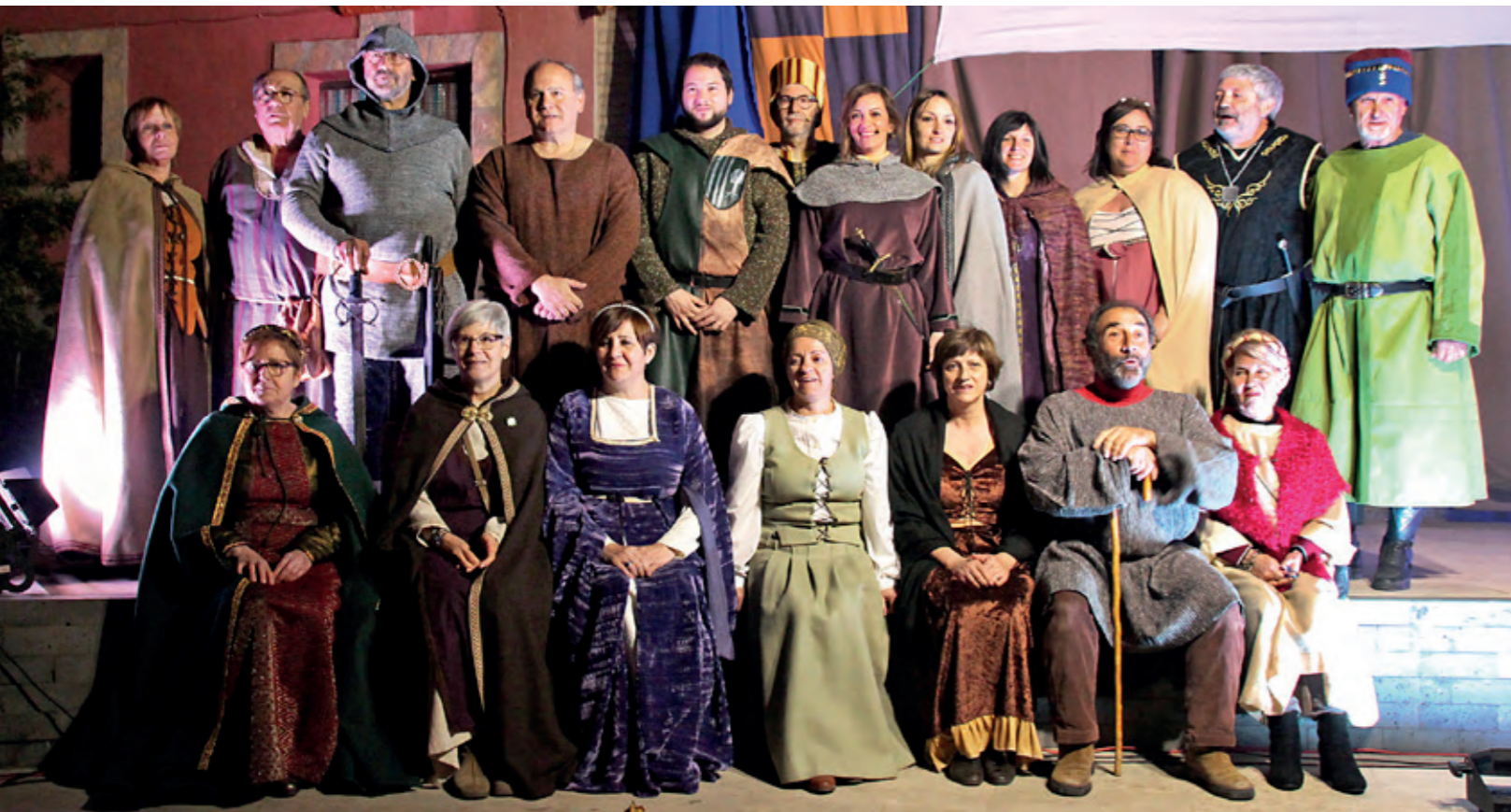
Elenco de la representación de La Dama del Olivar , de Tirso de Molina.

Ángel Terrén Cervera