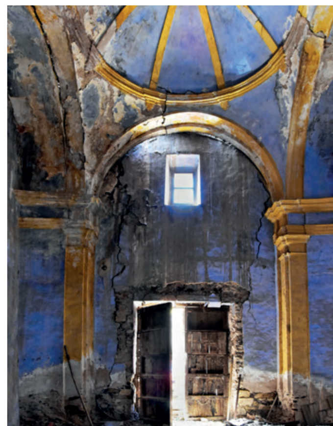
En la ermita de Santo Toribio destaca la altura de la nave.