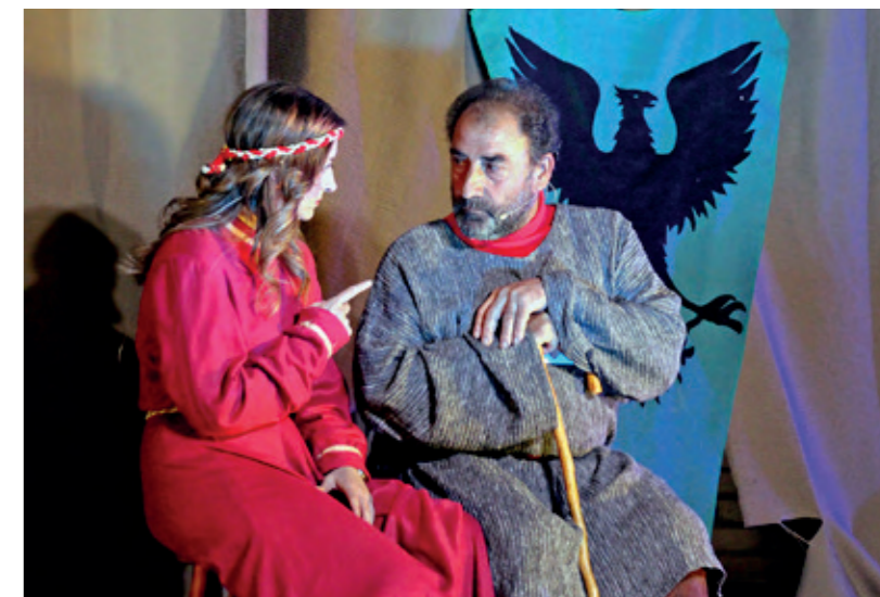
Una escena de La Dama del Olivar .

La participación de los estercuelanos fue inmejorable, tanto en la preparación y la ornamentación del pueblo, como por la aportación de las amas de casa; y excelente la dedicación, ganas, ilusión y entrega de quienes participaron en la representación teatral. El ayuntamiento, como siempre, sufragó los gastos que conlleva la celebración y hay que destacarlo. Gracias a todos.