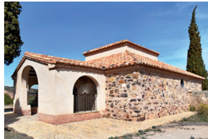
Ermita del Santo Sepulcro.