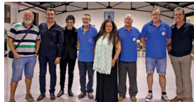
En el centro la ganadora de la Lámpara Minera 2018 tras el concierto ofrecido en el Pozo de San Juan.