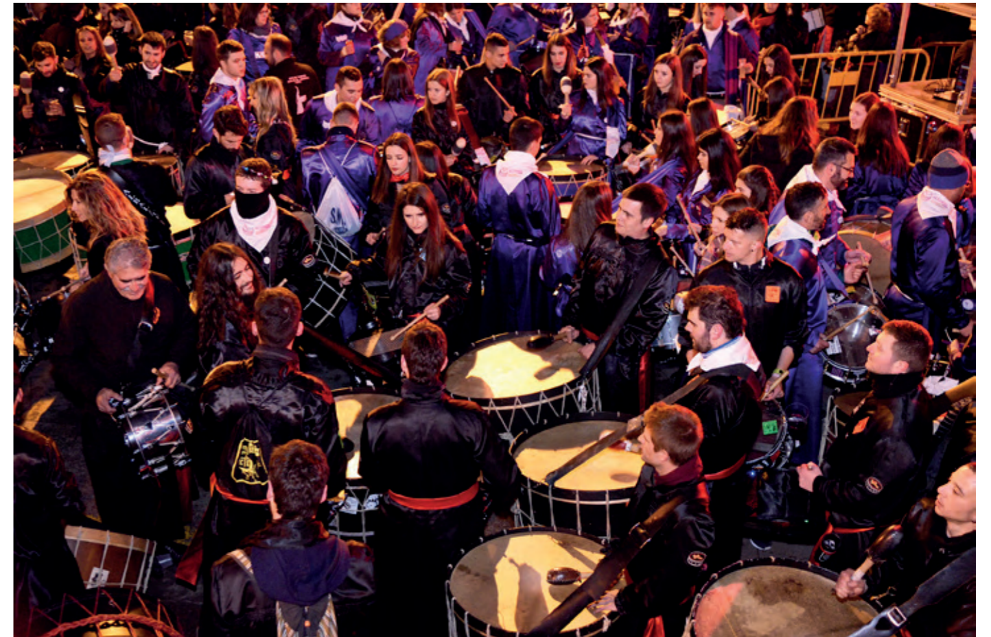
Tamborrada de los participantes en las jornadas celebrada el sábado 6 de abril a las 12,30 de la noche en la Plaza del Regallo.