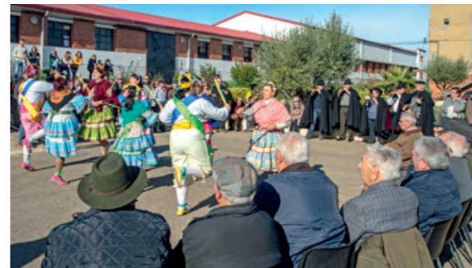
Celebración de Santa Bárbara en el pozo de San Juan (2018).