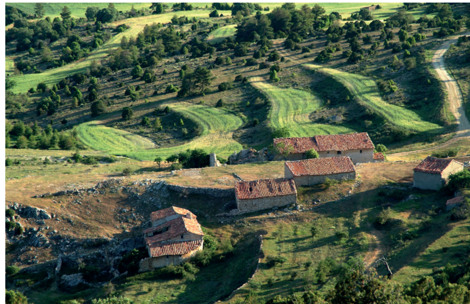
Masía de la Solana