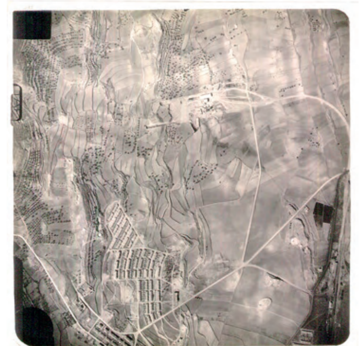
Vista aérea de los años 50. En la parte inferior de la imagen el poblado minero. En la parte superior hacia el centro las primeras instalaciones del pozo de San Juan.

Redacción del "Reglamento de acceso y consulta de documentos del Archivo del Museo Minero (MWINAS) de Andorra-Sierra de Arcos", con el fin de poder dar acceso a la documentación que se encuentra en el archivo a investigadores y ciudadanía en general.