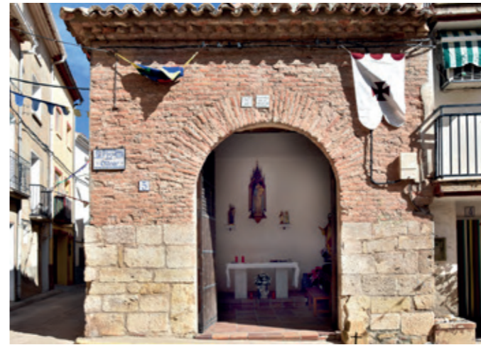
Ermita de Nuestra Señora del Olivar.

Nuestra Señora del Olivar estaba cuidada por los devotos, que acudían en procesión algunos días festivos, entre ellos el 8 y 9 de septiembre cuando se celebraba la fiesta dedicada a la patrona. No puede pasarnos desapercibido que esta ermita -además de la capilla de los Santos Mártires- es la única que el pueblo ha preservado siempre.