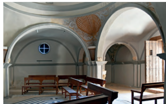
Interior de la ermita del Santo Sepulcro.