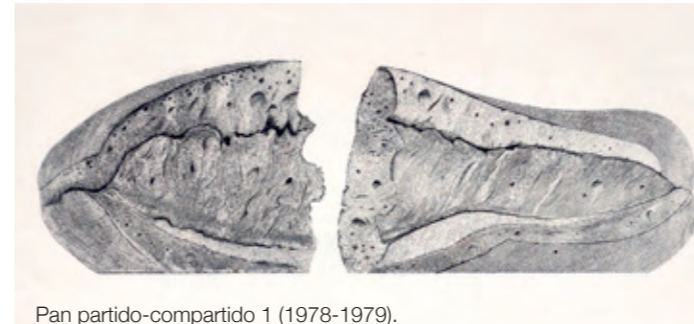
Pan partido-compartido 1 (1978-1979). Aguafuerte, Pablo Serrano.

Redacción Fotografía de Javier Alquézar Medina