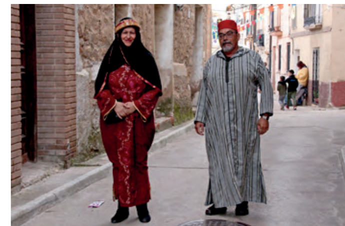
Ataviados para la celebración del VI Encuentro con la Historia.