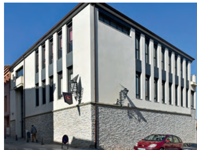
Casa de Cultura