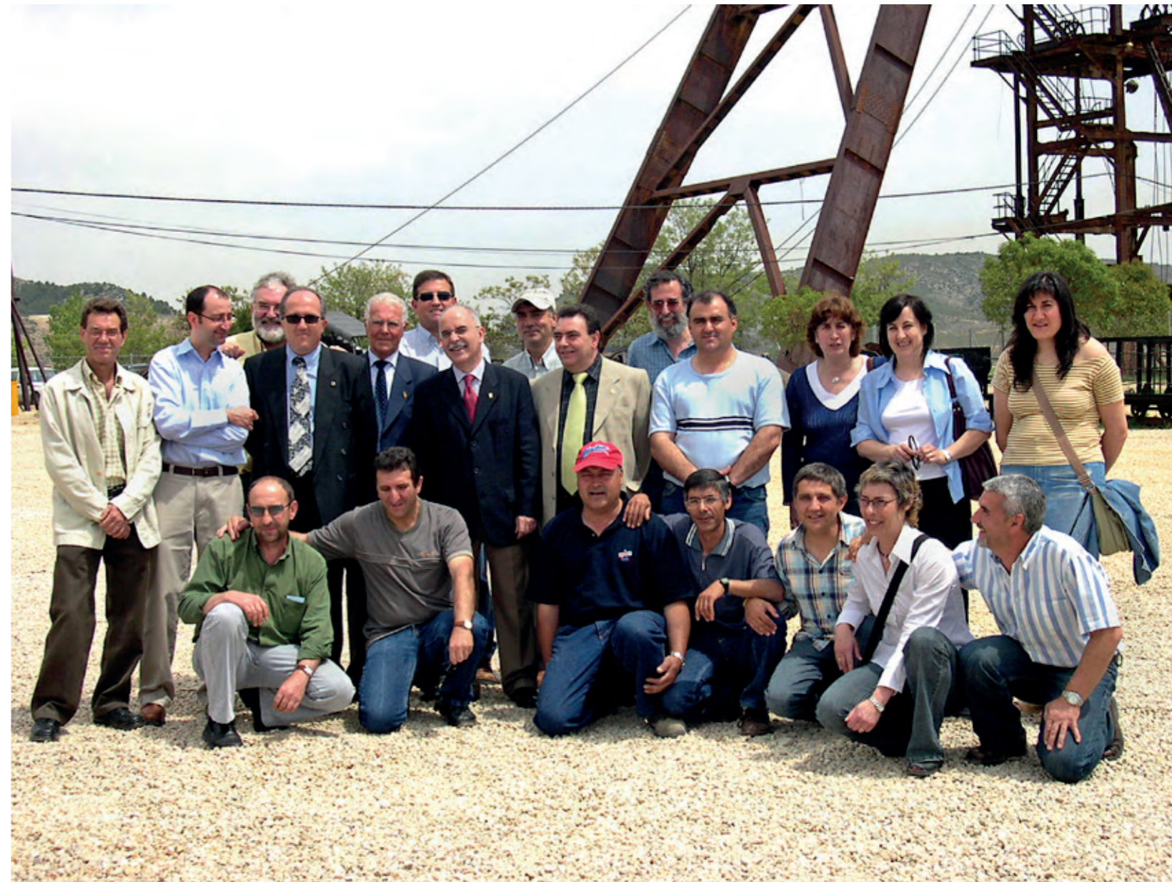
Equipo de trabajo para las jornadas El Oficio de Minero (2005) formado principalmente por mineros prejubilados, socios del Celan y políticos locales.

Exposición que pasó a ser permanente y que fue el germen del actual museo. Ya entonces colaboramos activamente en la recuperación de máquinas, en la recopilación de fotografías y en la celebración de las actividades que tuvieron lugar durante todo el mes con motivo de las jornadas. Desde ese momento ya nunca hemos dejado de trabajar por la recuperación del patrimonio minero, siempre vinculados al MWINAS.