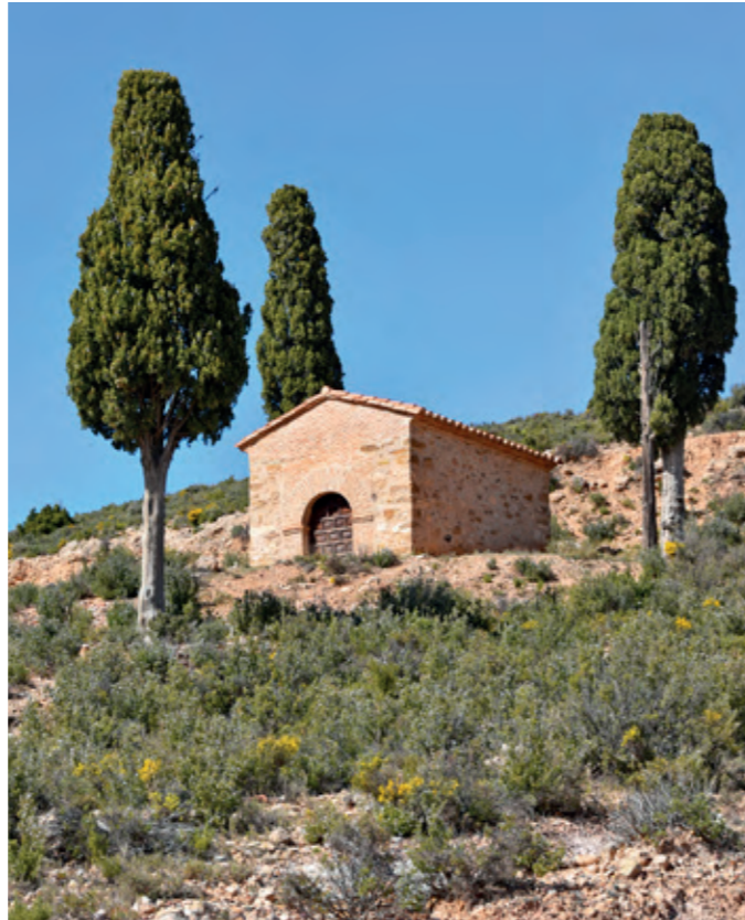
Ermita del Calvario (en el entorno del monasterio del Olivar).

Para terminar nuestro estudio hay que citar todavía dos ermitas que se encuentran en el entorno del monasterio. Por un lado, la del Pastor, construida en el siglo XVII al parecer en el punto donde cuenta la leyenda que se vio el resplandor de la Virgen del Olivar. Está frente al convento, en lo alto de un bosquecillo de pinos, en la partida de las Peñuelas. Es una pequeña construcción de planta cuadrada, con sillaría en las esquinas y alero de rasilla, arco de medio punto en el acceso y un altar sencillo dedicado a la Virgen del Olivar. Fue restaurada en 1896, según una inscripción pintada en el interior, y, de nuevo, en 1950. Y por otro, junto a una pista que conduce a Obón, surge una bonita ermita del Calvario entre cipreses, que ha sido restaurada recientemente.