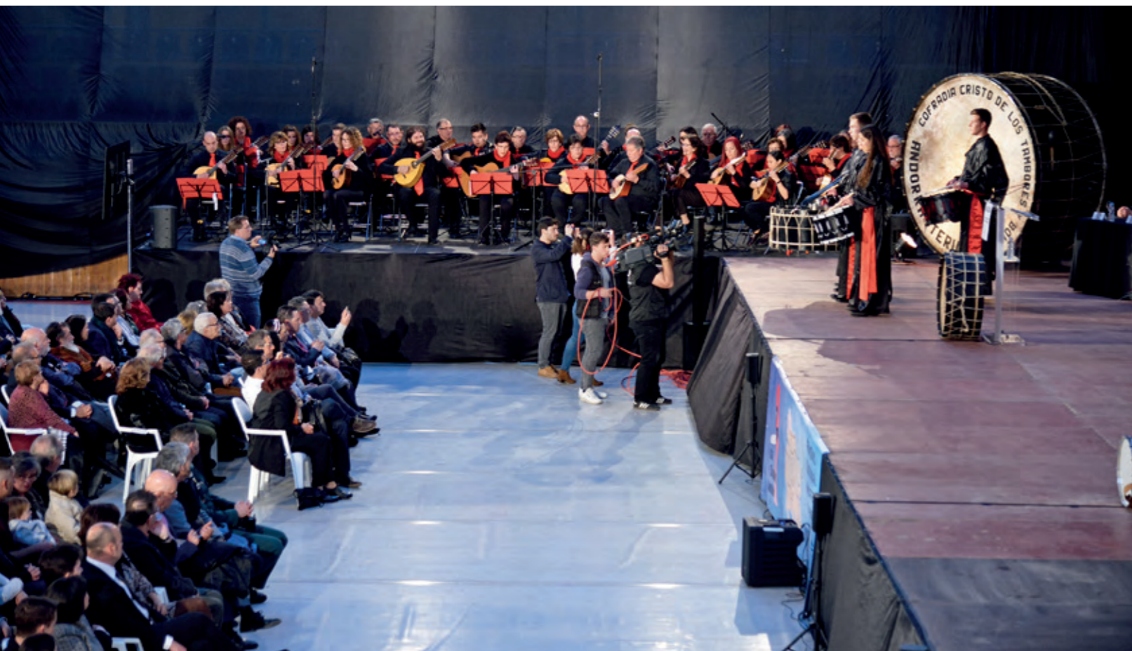
La Agrupación Laudística, con acompañamiento de bombos y tambores, durante su actuación en el acto del Pregón.

Coautor de los paneles que componen la exposición La Ruta del Tambor y Bombo del Bajo Aragón , que anualmente recorre uno de sus nueve pueblos, ha escrito artículos en publicaciones como el libro Entre Tambores. El Bajo Aragón durante la Semana Santa , editada por la Ruta en 2002, o en Comarca de Andorra-Sierra de Arcos , número 27 de la Colección Territorio 31, editada por el Gobierno de Aragón en 2008.