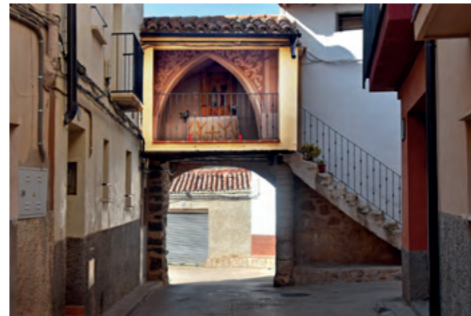
Capilla de los Santos Mártires.