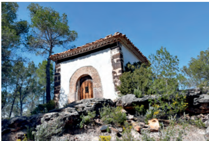
Ermita del Pastor (frente al monasterio del Olivar).