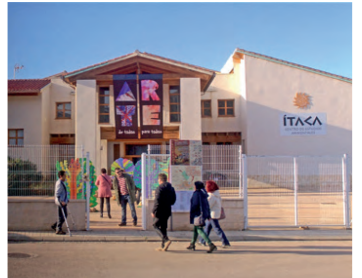
Centro de Estudios Ambientales Ítaca "José Luis Irazo".

Creo que se valora positivamente. Nosotros cuando elaboramos el programa anual lo hacemos pensando en todos los públicos, no solo nos centramos en unas edades y gustos determinados, intentamos que todo lo que ofertamos sea del agrado de todos, aunque no siempre es fácil que todos estén contentos. De todas formas, se tienen en cuenta las aportaciones de los representantes del Patronato para sacar a la luz aquellas peticiones que nos parecen más interesantes. En general, desde el Patronato, intentamos que las actividades sean lo más variadas e interesantes dentro de nuestras limitaciones.