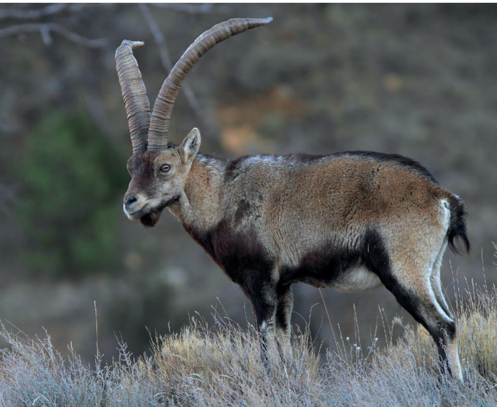
Macho de cabra montés.