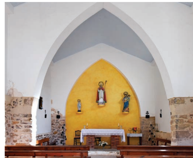
Ermita de San Blas, interior dividido por un arco apuntado.

cerrarla para siempre". Los restos de aquella primitiva ermita de San Blas, que en el pueblo se conoce como San Blas de las Viñas, son visibles por ejemplo desde el Collado o desde la Torreta. Se encuentran al otro lado del río, en el extremo de un campo de almendros, rodeado de otros bancales yermos, sin rastro de las viñas que se concentraban en esta parte del término municipal. Las ruinas han sido reaprovechadas en parte como refugio y no sugieren gran cosa, pero el nombre no puede ser más evocador. En terrenos próximos hay un polígono industrial conocido como San Blas de las Viñas, de modo que la denominación subsiste, aunque ya casi nadie se acuerde de aquella ermita.