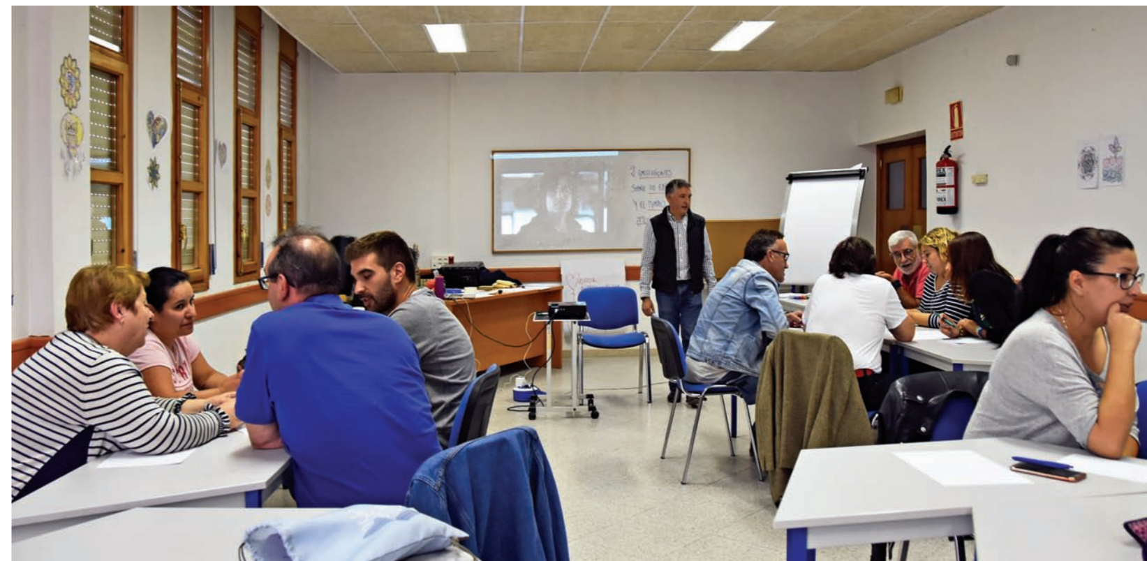
Impartiendo un taller de Gestión emocional.

Número de socios: 663 Número de voluntarios: 179 Cruz Roja Juventud: 23