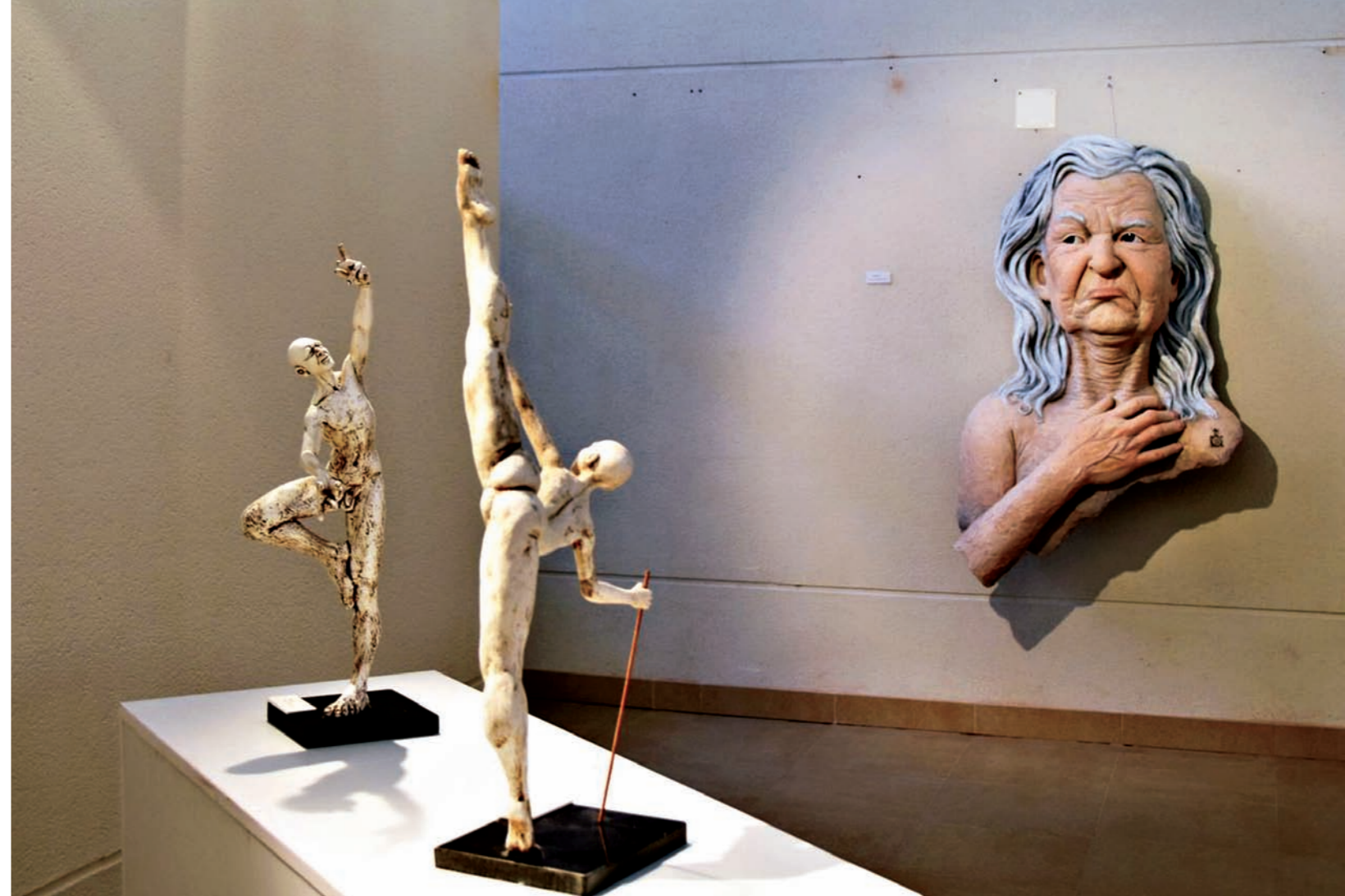
Algunas de las "martingalas" expuestas en Crivillén.

Treinta piezas de materiales muy diversos: madera, hierro, poliéster, mármol y alabastro; material, este último, con el que más a gusto se siente trabajando. Un material muy noble y con unas cualidades para la escultura impresionantes, tal y como explicó al numeroso público que asistió a la inauguración. Precisamente con una delicada escultura de alabastro, Maternidad , que también formaba parte de la exposición, ganó el primer premio de escultura en la III Bienal Andorra-Sierra de Arcos. Una muestra muy ecléctica, en la que confluyen obras más personales con otras en las que su oficio como artista fallero está muy presente.