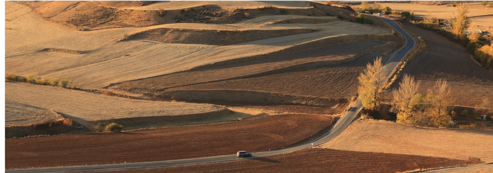
El otoño tiñe de ocres The Silent Route a su paso por Ejulve.

La comarca de Andorra-Sierra de Arcos y la comarca de Maestrazgo comparten el trazado de la carretera A-1702, entre la Venta la Pintada (Gargallo) y el puerto de Cuarto Pelado (Cantavieja), una carretera que en sí misma ya es un atractivo turístico. En apenas 63 kilómetros, su serpenteante trazado recorre alguno de los paisajes más bonitos y agrestes de Teruel, da acceso a espacios naturales y patrimoniales extraordinarios, discurre por pueblos de dilatada historia, etc. A esto se une el escaso tráfico, un trazado difícil, repleto de curvas y tramos complicados que para los potenciales visitantes es uno de sus mayores atractivos.