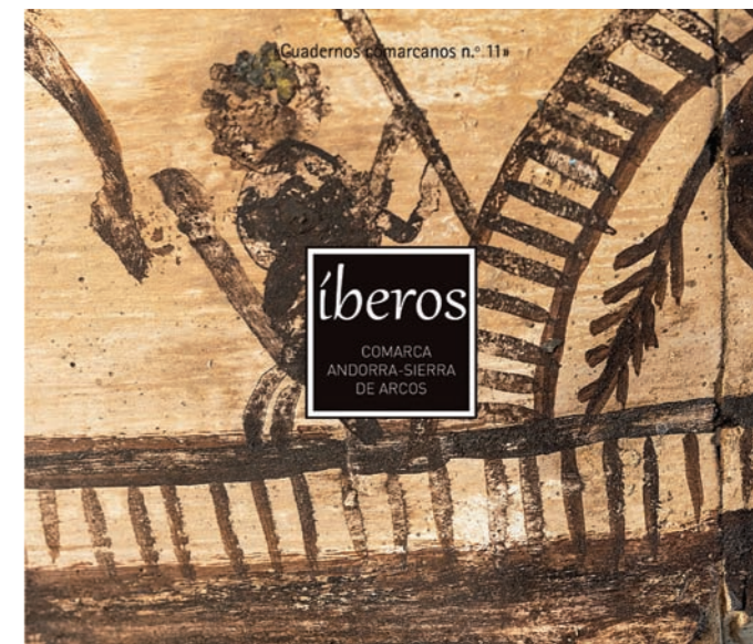
Un detalle de uno de los kalathos encontrados en El Castellillo de Alloza es el motivo utilizado en la portada del libro.

Una publicación en la que los autores hemos puesto mucho cariño y que ha sido tratado con mucho mimo por el CELAN, como todas las cosas que se hacen en este centro de estudios locales, uno de los más activos de la provincia y con más prestigio de Aragón. Un libro con el que hemos pretendido dar a conocer una de las culturas más fascinantes que se han dado en la península ibérica.