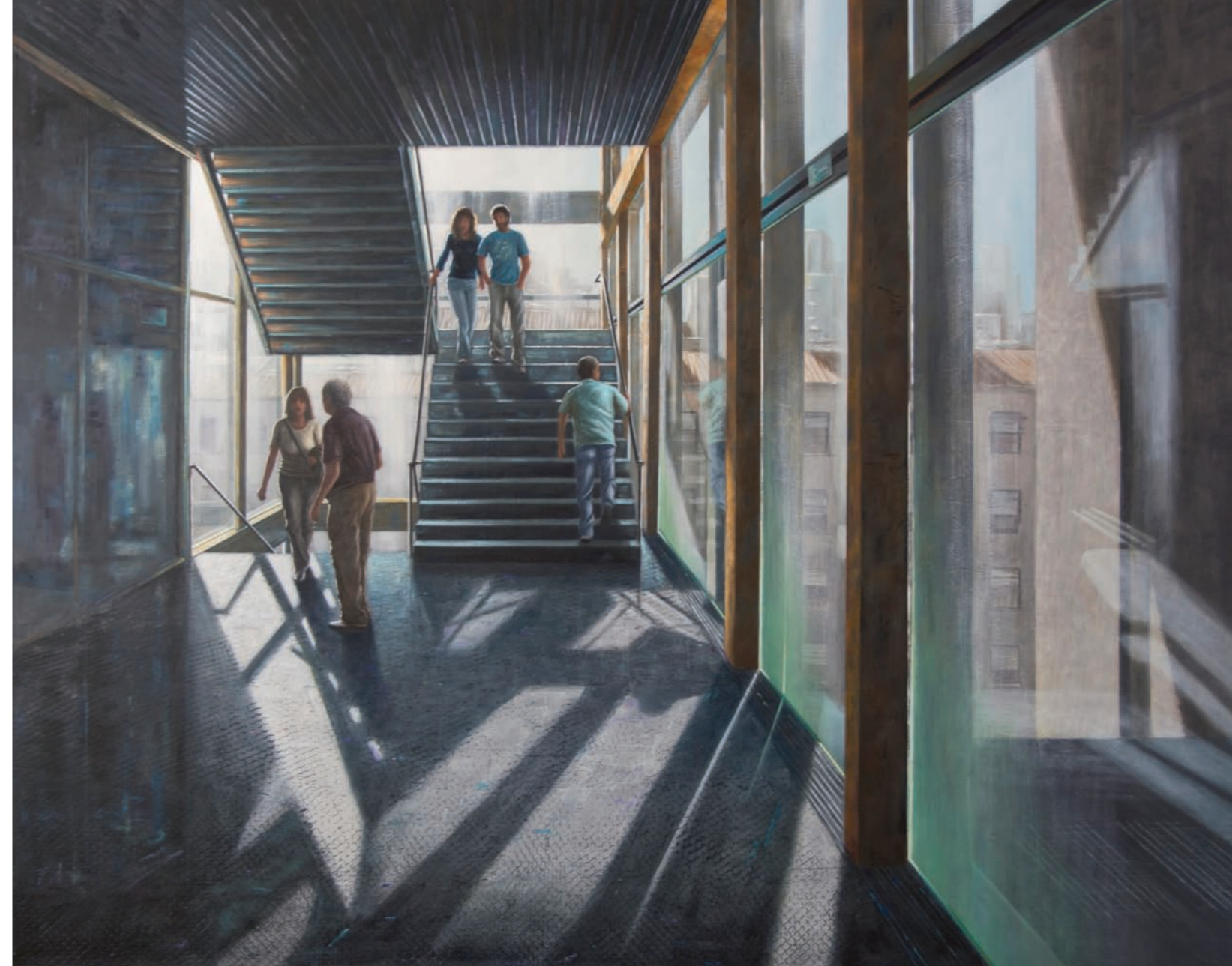
Por la escalera , José Pedro Izquierdo. 150 x 118 cm, 2018.