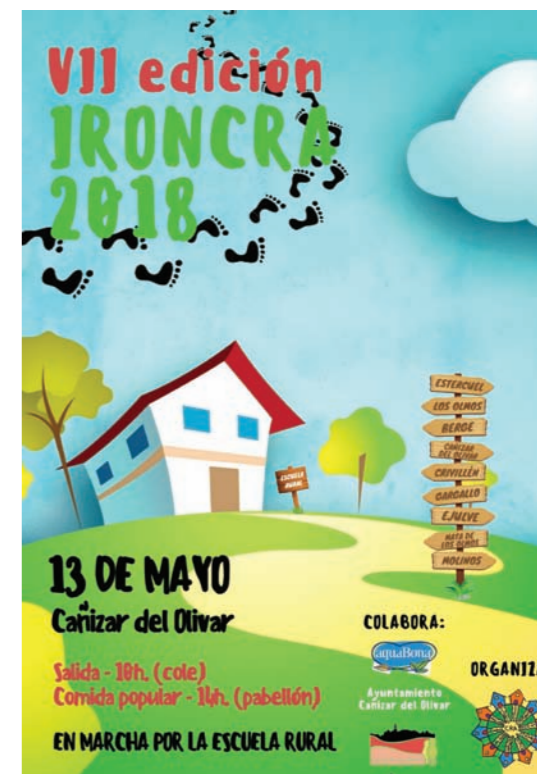
Cartel de la última edición, 2018.

Mantener las ganas de trabajar por la escuela rural; lograr más recursos en nuestras escuelas, fruto de la innovación y la reivindicación: desdobles y ratios más favorables para las aulas multinivelares, conexión por fibra en todos los pueblos y mejoras en nuevas tecnologías; que la administración conozca nuestra trayectoria y nos apoye y mantenga un seminario de formación en Alcorisa, al que se ha apuntado profesorado de otros CRA, Olea (Castellote), Muniesa, Ariño-Alloza, Somontano-Bajo Aragón y Bajo Martín. Y este año, por primera vez, ser considerado nuestro CRA como centro de difícil desempeño, con lo que el profesorado que se ha incorporado este curso lo ha hecho de forma voluntaria y por tres años, participando y dando continuidad a nuestros proyectos de innovación.