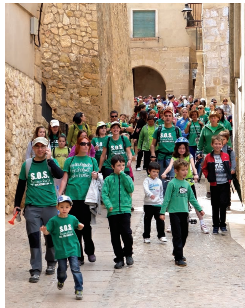
Salida de Molinos hacia Berge en la primera edición de IRONCRA.