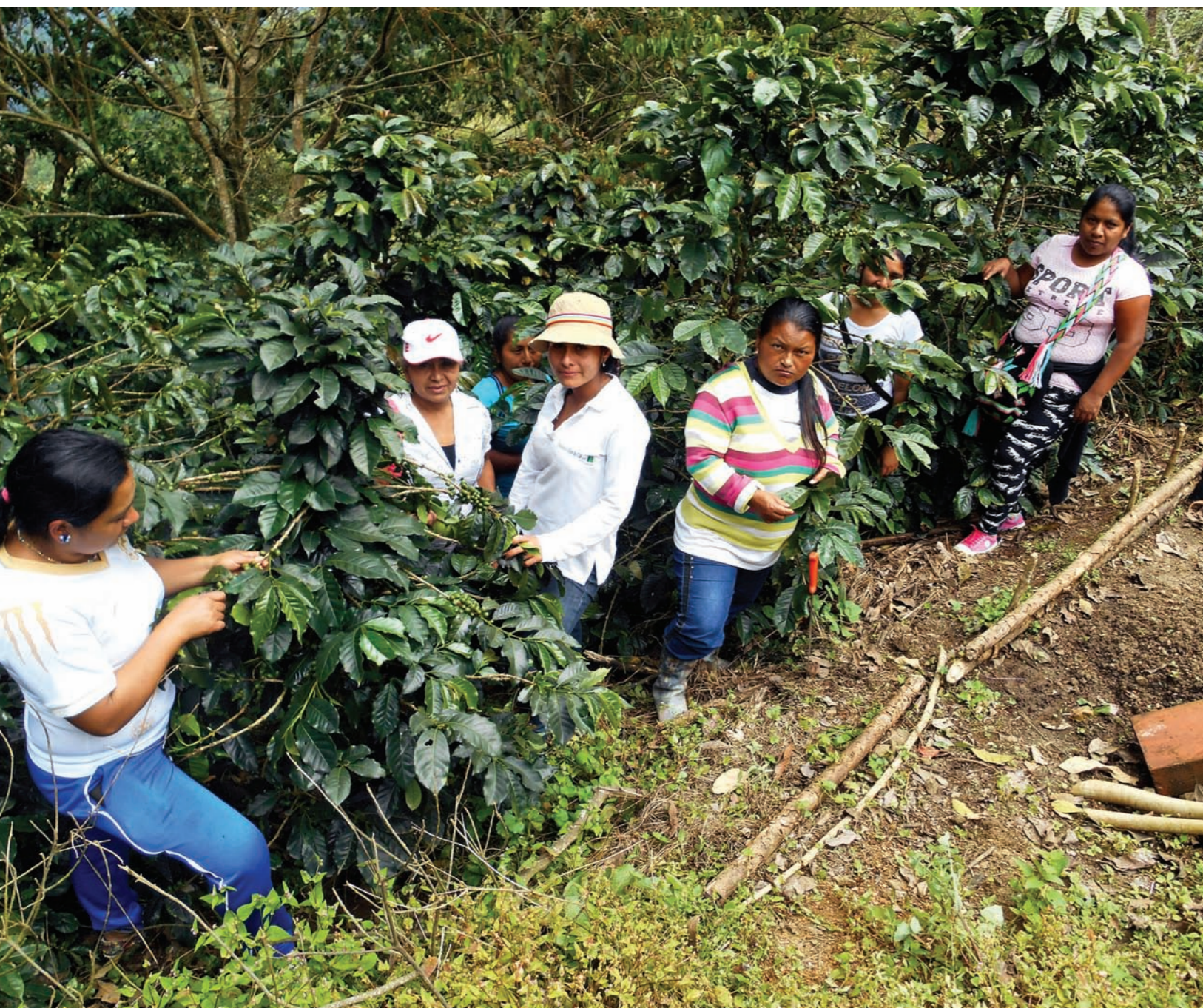
Un grupo de mujeres nasa participantes en el proyecto.

Pilar Sarto Fraj