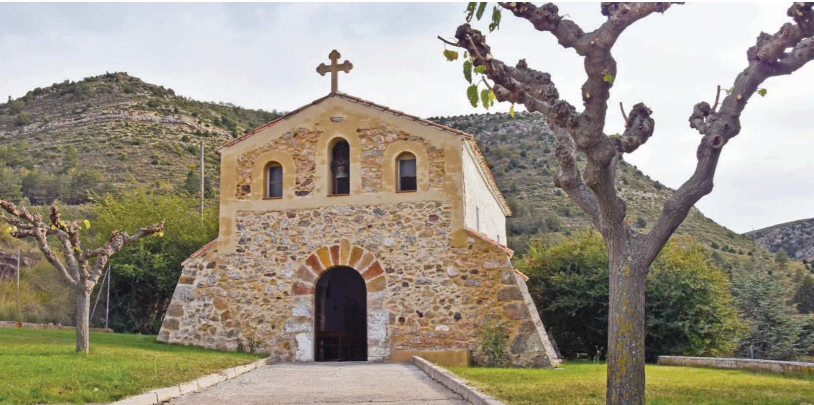
Ermita de San Blas, patrón de Gargallo.