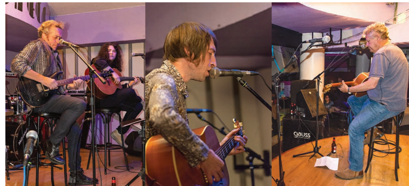
Connie Corleone & Cossío Dúo