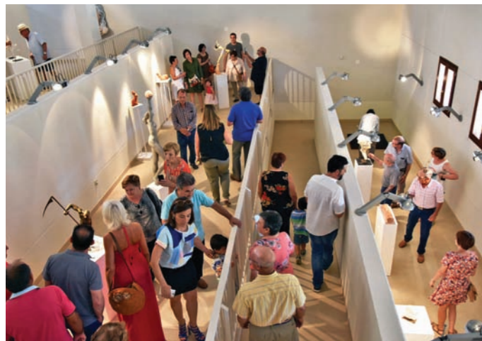
Los asistentes pudieron visitar la exposición y compartir sus opiniones con el artista tras la inauguración.

M. a Ángeles Tomás Obón