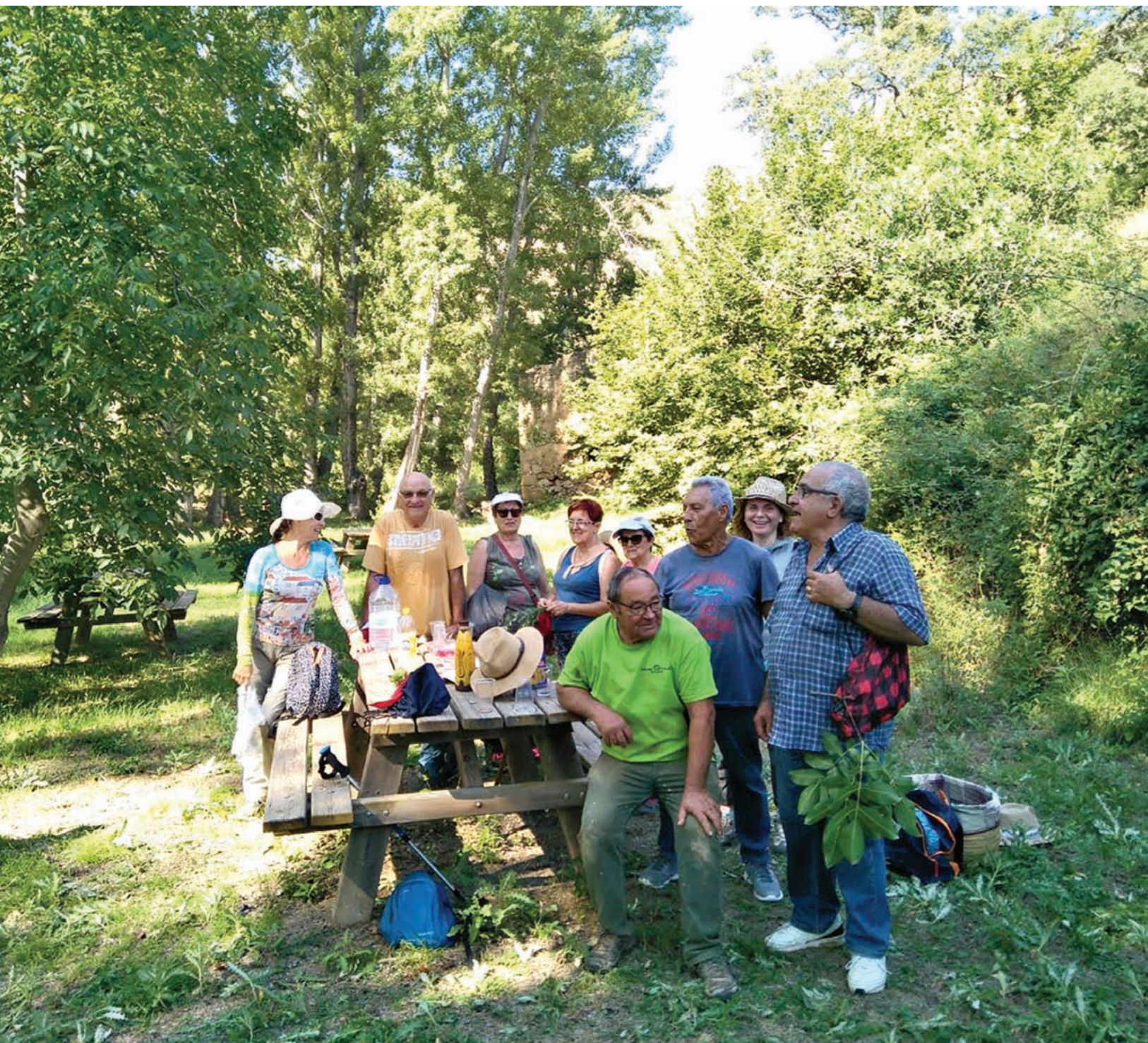
Andada popular 2018.

Junta de la Asociación Cultural Amigos de las Calderas Fotografías del archivo de la asociación