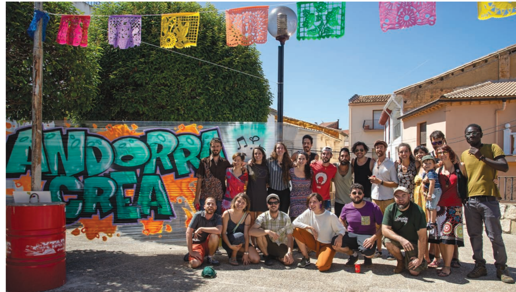
El Colectivo en Construcción, que hizo posible el vermú creativo.

Cristina Alquézar Villarroya