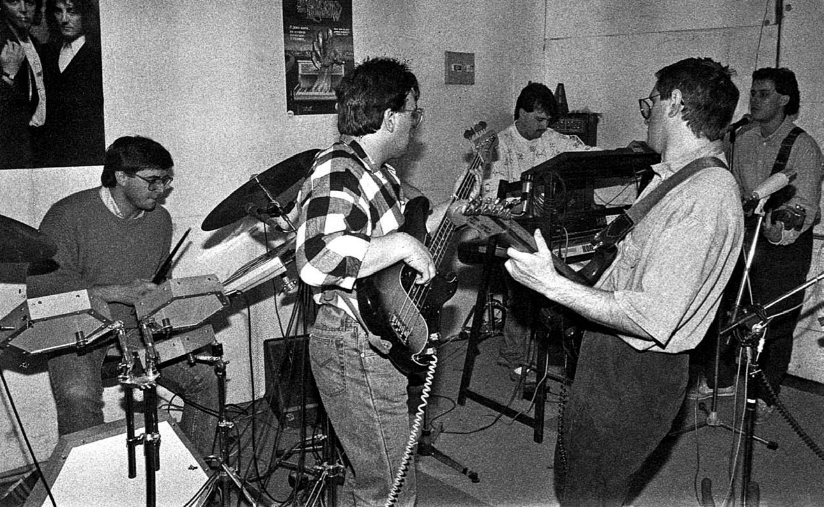
Fenómenos Extraños en el local de ensayo.