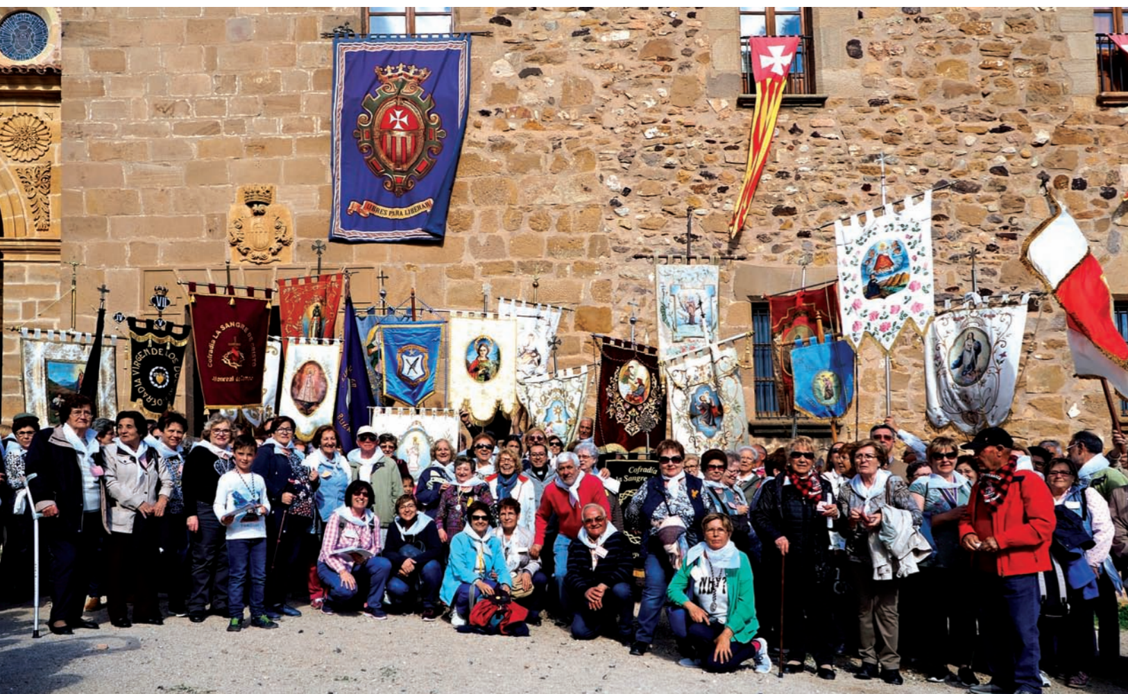
El monasterio del Olivar (Estercuel) ha acogido durante todo el año 2018 numerosos actos y encuentros para celebrar el 800 aniversario de la Orden de la Merced, a la que pertenece.