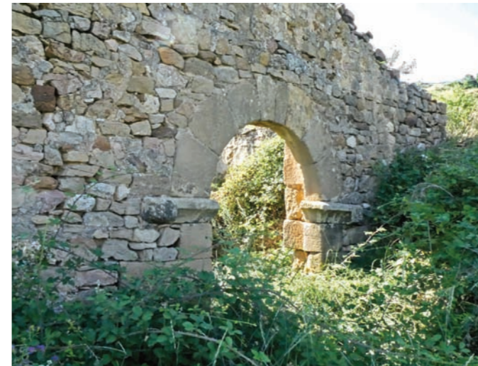
Arco de entrada a la ermita de las Santas Justa y Rufina.

Las escasas noticias documentales que conocemos acerca de las dos ermitas más antiguas de la localidad son solo un poco posteriores a esa época de penuria. Las visitas pastorales de 1805 y 1849 recogen una dedicada a san Blas, distante del pueblo media hora, que ya no recibía culto. Estaba desvalijada y profanada, y "el cura es partidario de tabicarla o derruirla". Se cita asimismo otra bajo la invocación de las santas Justa y Rufina, sin rentas, que también estaba profanada y "el cura es del mismo parecer,