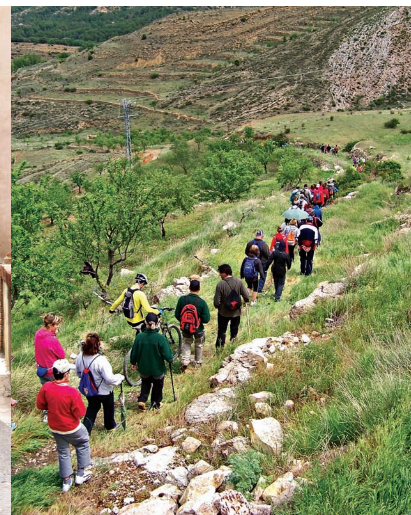
Bajada de Gargallo a Crivillén por el sendero antiguo.