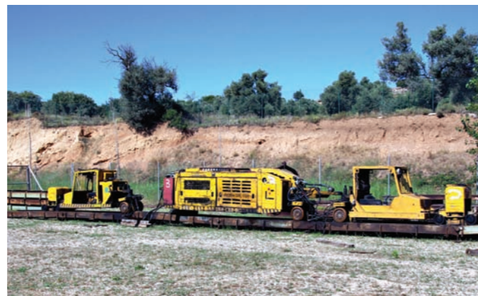
Esta locomotora de dos cabinas se utilizaba para transportar materiales y personas en el interior de la mina. Está todavía pendiente de restauración.