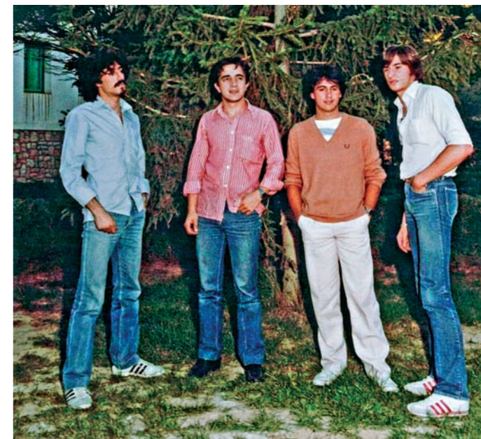
Primera formación de Acolla.

Escribiendo estas líneas me acaban de comunicar que la Asociación Musical Deluxe ha recibido un premio del Patronato de Cultura, mi más sincera enhorabuena, chicos.