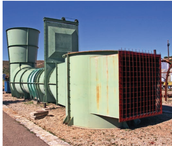
Este ventilador es uno de los nuevos elementos expuestos en el museo minero. Su misión era extraer el aire viciado de la mina.

La incorporación de todos estos nuevos elementos al museo ha sido posible gracias al trabajo continuado y paciente de la asociación cultural Pozo de San Juan, cuyos voluntarios se encargan de localizar las piezas, recuperarlas, restaurarlas y mantenerlas en condiciones para su exposición, así como de la labor de concienciación sobre la necesidad de conservar nuestro patrimonio minero.