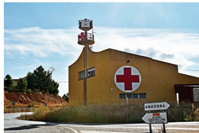
Edificio de la Cruz Roja desde la carretera de entrada a Andorra.