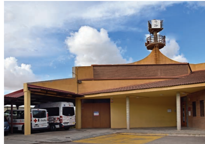
Entrada principal a la Cruz Roja de Andorra.

Pero es fundamentalmente en la década de los noventa cuando se produce la gran modernización de la institución y su adaptación a los nuevos retos que planteaba la sociedad española; por un lado, la consolidación de la intervención social con los colectivos vulnerables y, por otro, el espectacular incremento de los programas internacionales (cooperación al desarrollo, ayuda humanitaria, cooperación institucional), que ha supuesto un importante aumento de los recursos humanos y materiales dedicados a este ámbito. Todo ello acompañado por un proceso de modernización y democratización de las estructuras y la dotación de una mayor autonomía a los centros locales.