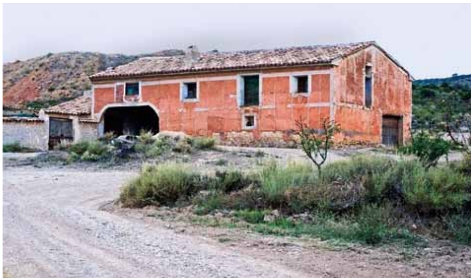
Su casa roya, da nombre al producto

Las brescas: Son los trocicos que quedan después de sacar la miel, una especie de trozo de panal. Aunque no es un producto en sí, los niños los comían como si fueran caramelos. . . Se hacía una especie de bola con la miel y la cera mezcladas, y luego se escupe la cera.