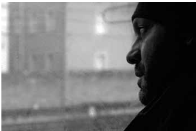
Fotograma de Cenizas , la película ganadora.