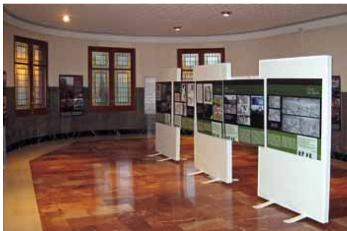
La exposición en el IES Ramón y Cajal, Huesca.

La exposición, realizada por el CELAN dentro de las jornadas conmemorativas de la Primera Guerra Mundial organizadas en la pasada primavera, va a ser la más viajera de todas las realizadas por el Centro de Estudios. Al terminar las jornadas, pasó al IES Pablo Serrano de Andorra y a la vuelta del verano recaló en la biblioteca de Alcañiz. De ahí viajó a Huesca (IES Ramón y Cajal), Fuentes de Ebro (IES Benjamín Jarnés) y a tres institutos de Zaragoza (Portillo, Grande Covián, Pablo Serrano). Seguirá en 2015 en los institutos Ramón y Cajal y Pedro de Luna (de Zaragoza) y en el IES Torre de los Espejos (Utebo).