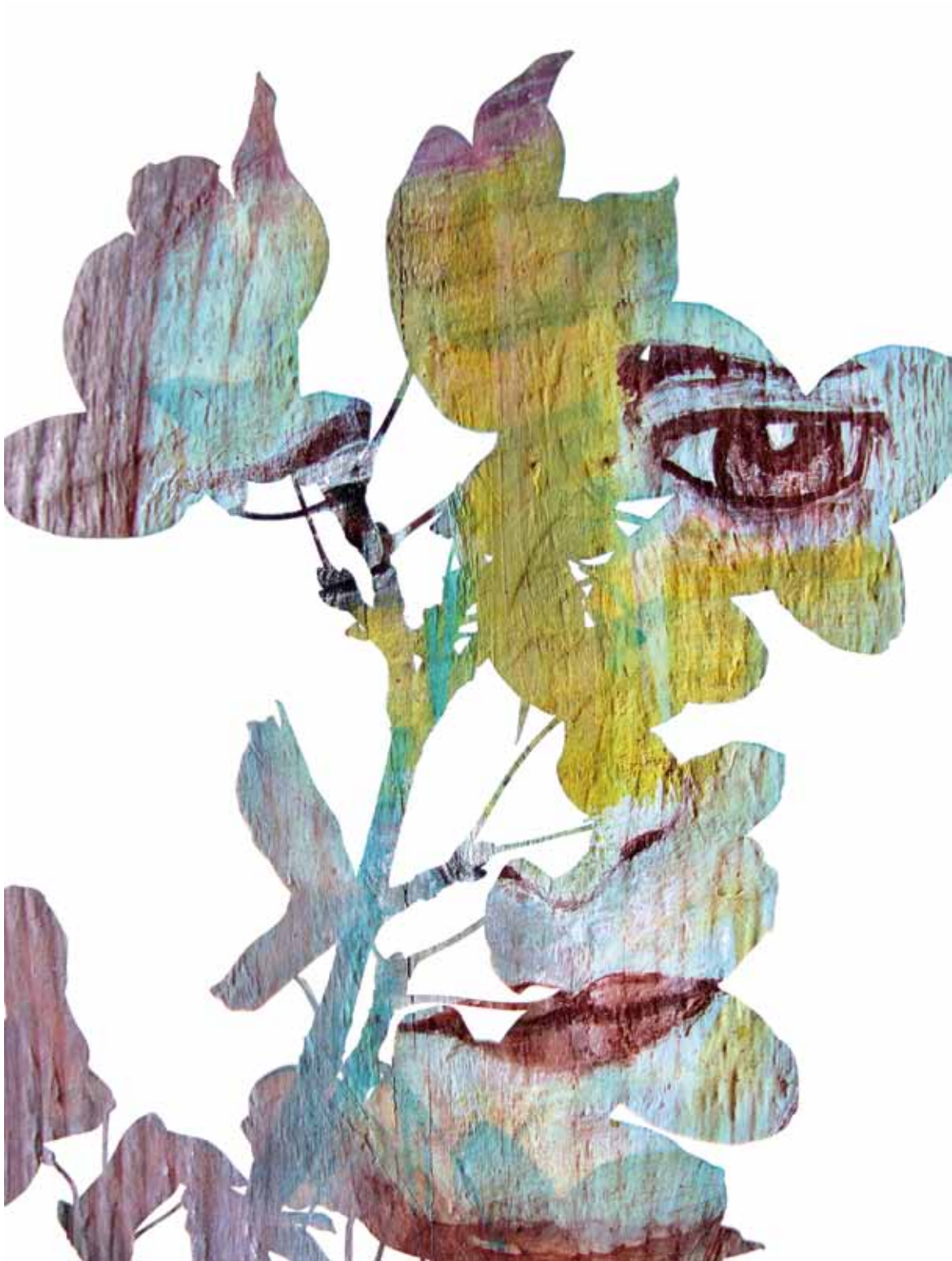
Autora: María Pérez Título: Mimesis Técnica: Ilustración digital