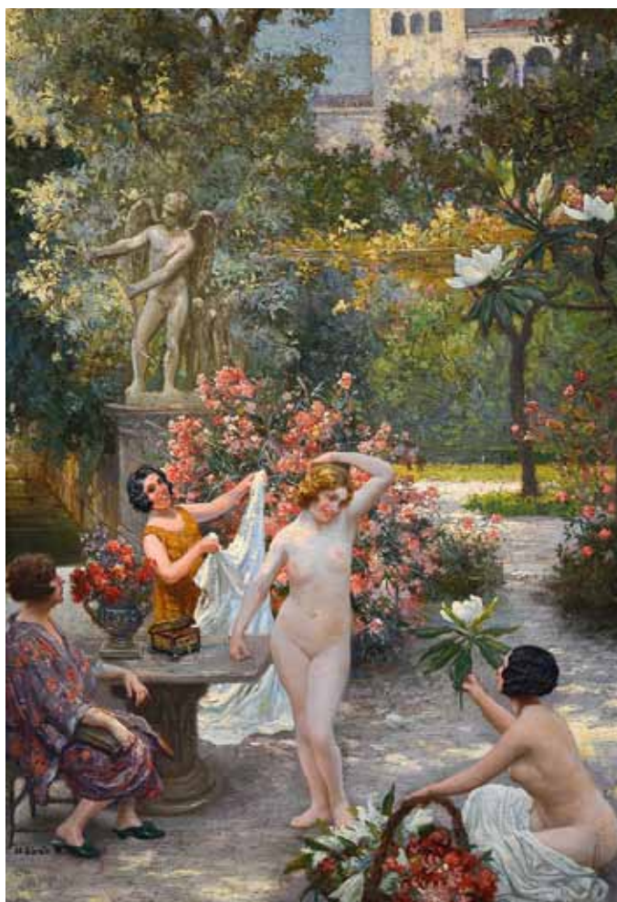
Tertulia en el jardín, 1910-1920, óleo.