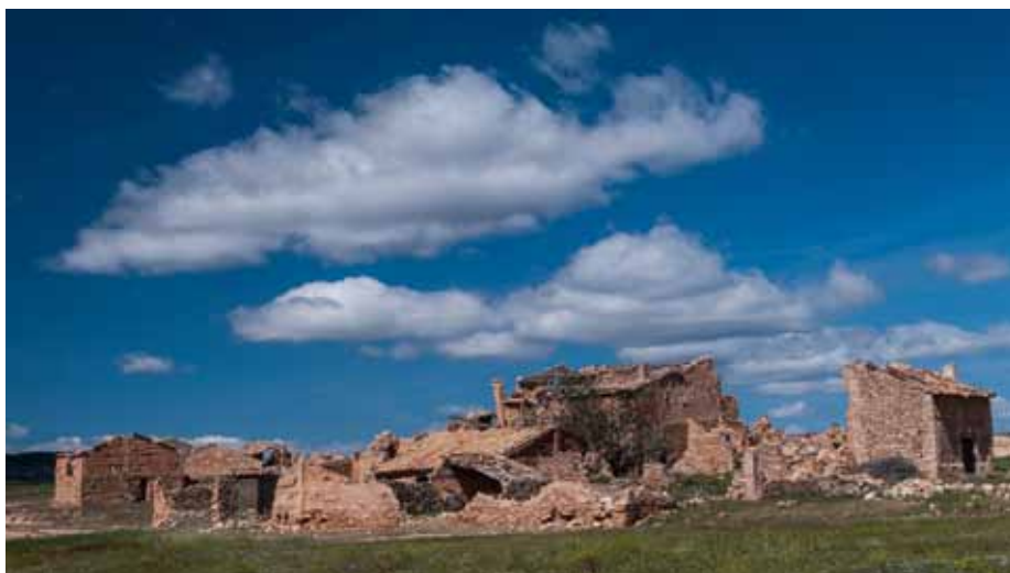
Mas de Alquézar

Allí tenían mas los Barrenas, Laudencios y Pitongos (el único en pie). Había dos balsetes.