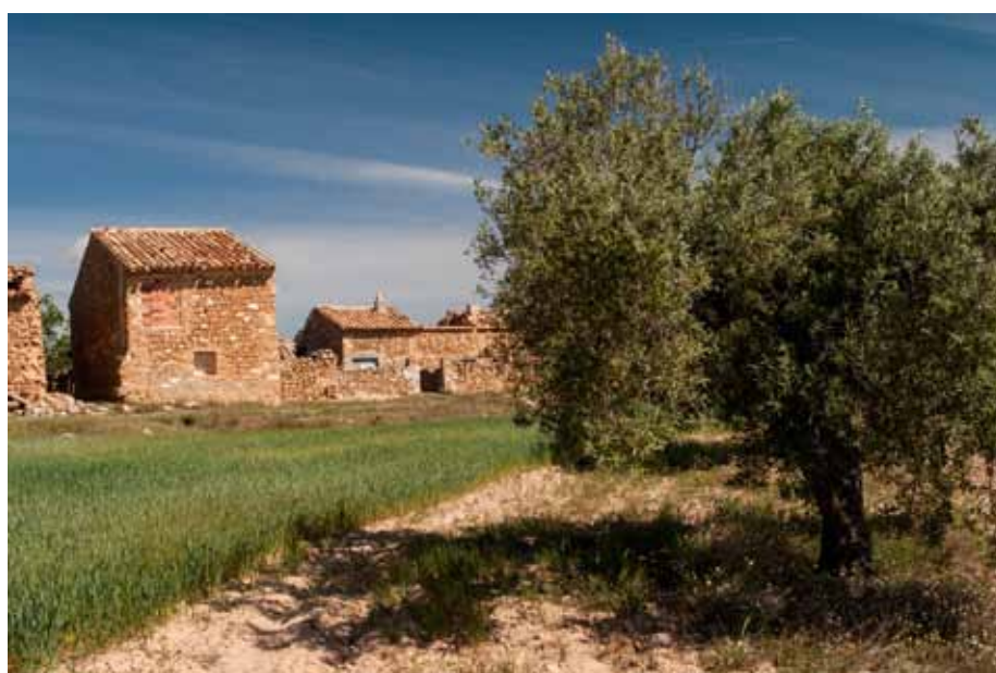
Mas del Santo