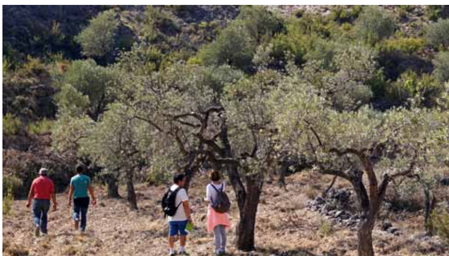
Olivos recuperados en el paraje de Sancha Abarca reciben la visita de sus padrinos.

conjunto con el objetivo de ampliar el número de padrinos, ampliar los mercados potenciales para el producto del aceite de calidad fabricado bajo un acuerdo de custodia y para planificar conjuntamente una estrategia de captación de fondos y nuevas iniciativas. En estos momentos están trabajando conjuntamente en la posibilidad de poner en marcha el proyecto "Cada mochuelo a su olivo". La vida de los mochuelos está muy ligada al cultivo tradicional del olivo, pues los olivares son su hábitat natural, pero esta especie es muy sensible al uso de productos fitosanitarios y su población se ha visto reducida en muchos lugares en los últimos años; aprovechando que el olivar que se está recuperando va a ser totalmente ecológico se están planteando importar este proyecto puesto en marcha con éxito en otros lugares de la península.