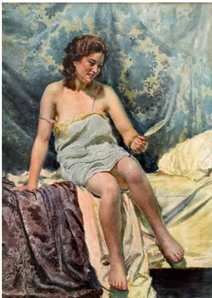
Despertar, 1935, acuarela.

Una vez devueltas las obras a sus propietarios nos queda como recordatorio un excelente catálogo con todos los cuadros de la muestra y el reto, tras esta positiva experiencia de una exposición de producción propia fruto de la colaboración de varias instituciones, de una posible exposición mucho más ambiciosa del legado de Gárate en Aragón.