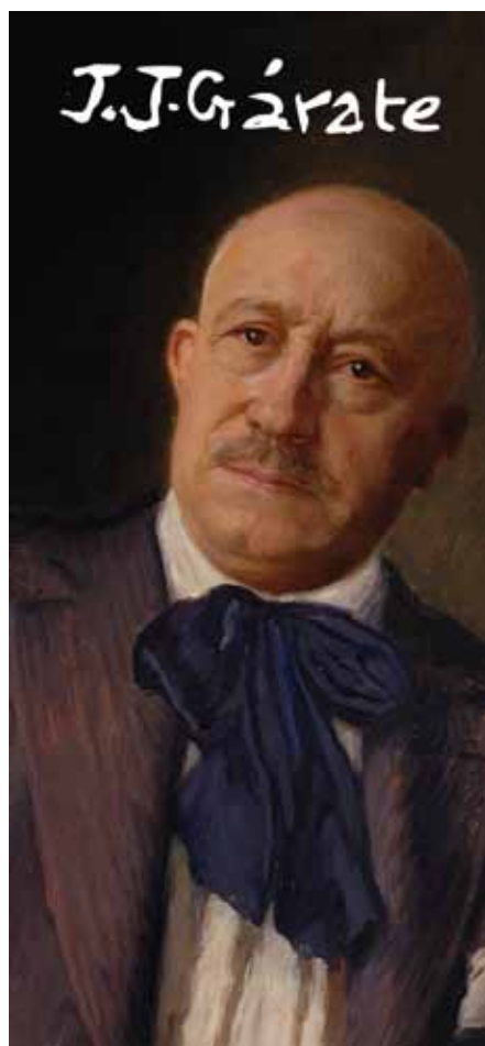
Autorretrato, marcapáginas conmemorativo .