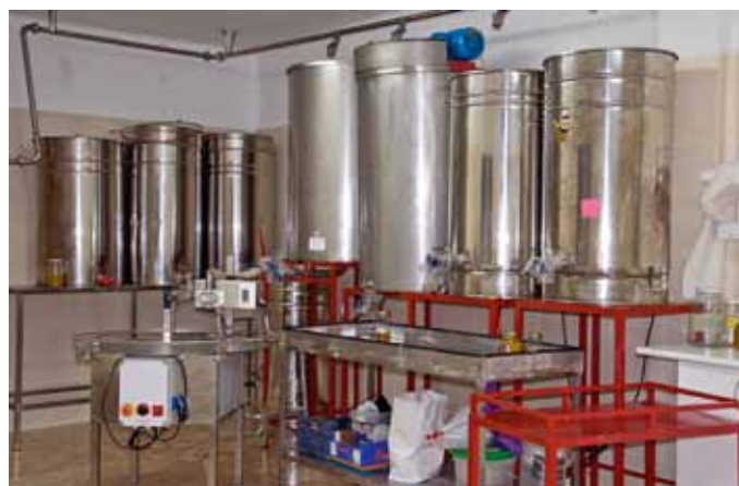
Sedimentación, reposo y maduración