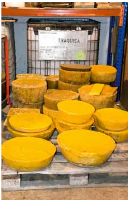
Cera elaborada tras el prensado

La cera. Se utiliza una especie de prensa y se consiguen unos cilindros de cera que se venden para cosméticos y elaboración de velas, además de otros usos.