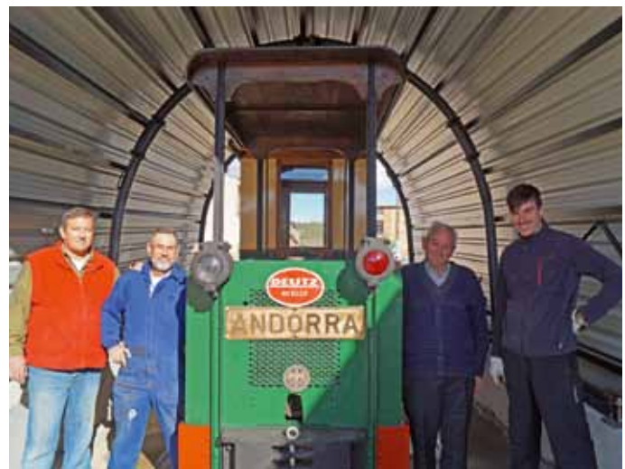
Parte del equipo de voluntarios de la asociación cultural Pozo de San Juan que han estado trabajando para la puesta a punto de este nuevo atractivo del museo.