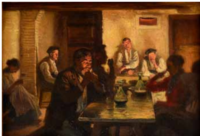
En la taberna, sin fecha , óleo.