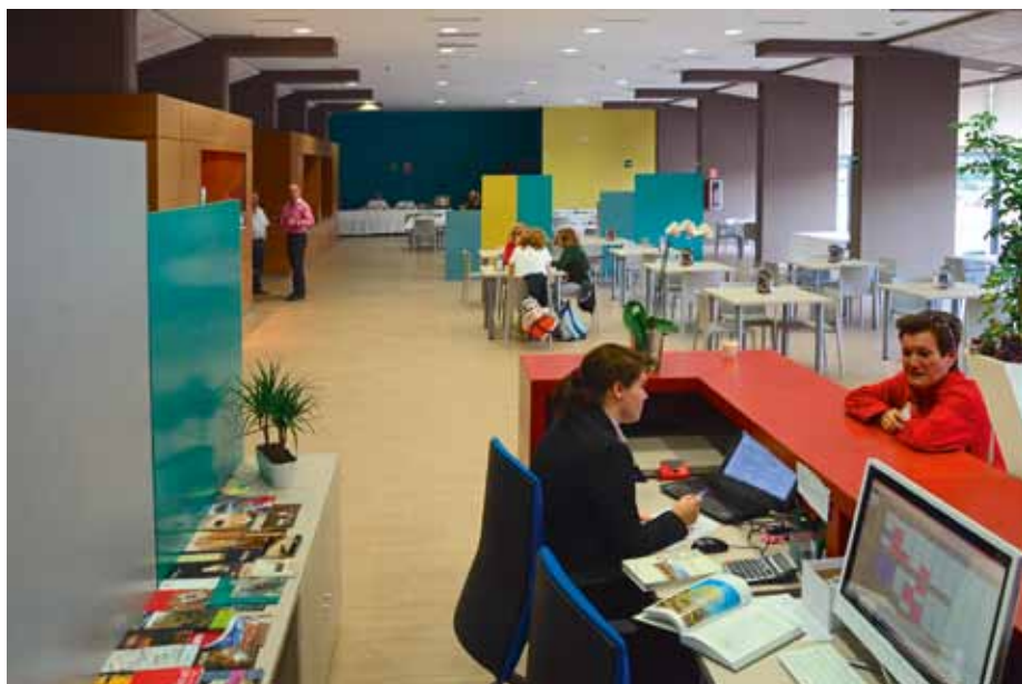
Área de recepción y cafetería

independientemente y tienen autonomía para definir su imagen en función de la realidad del destino. La gestión del hotel balneario de Ariño también será independiente y para ello se ha creado la empresa Hotel Balneario Ariño SL, que gestionará un centro balneario con oferta hotelera. Su gerente insiste en que se trata de un centro sanitario con oferta hotelera. Esta combinación es lo que les convierte en un producto único en todo el Bajo Aragón y lo que les diferencia de otros establecimientos con oferta de spa . Hay que distinguir entre lo que es el turismo de salud -muy de moda, pero al mismo tiempo un sector muy castigado porque hay muchas ofertas, muchos hoteles que ofrecen spa gratis y una competencia muy dura- y lo que es el termalismo y un balneario tradicional en el que se desarrollan tratamientos medicalizados con aguas minero-medicinales en un entorno turístico. Es esta variante terapéutica la que les diferencia y la que les ayuda a fidelizar a los clientes, pues tras su estancia su estado de salud mejora.