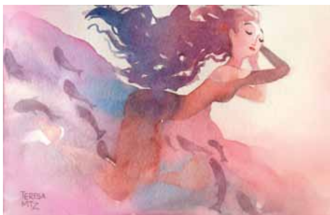
Mármara (acuarela de Teresa Martínez, licencia Creative Commons)

Sin ningún género de dudas: el mar más mar es el de Mármara.