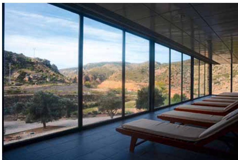
Solarium junto a la piscina termal

Toda la información sobre sus instalaciones, servicios y promociones especiales puede encontrarse en su web: www.balneariodearino.com