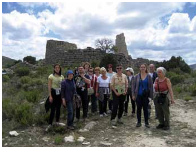
APUDEPA en el poblado de San Pedro, Oliete.

Pero los integrantes de APUDEPA no fueron los únicos que han conocido recientemente la riqueza patrimonial del Parque Cultural del Río Martín. El frontón de la Tía Chula de Oliete fue uno de los dos lugares elegidos en Aragón por el Instituto de Patrimonio Cultural de España para realizar las Jornadas Europeas de Patrimonio que promueve el Consejo de Europa. Los cien participantes visitaron este lugar el 20 de septiembre, en el equinoccio de otoño, para observar el santuario solar. Pese a las nubes, pudieron disfrutar del fenómeno -recogido en el BCI número 23- y de las explicaciones de Miguel Giribets, y de la visita al Centro de Interpretación de