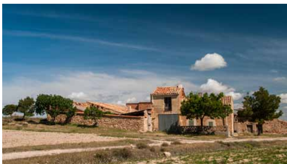
Ifesa de arriba