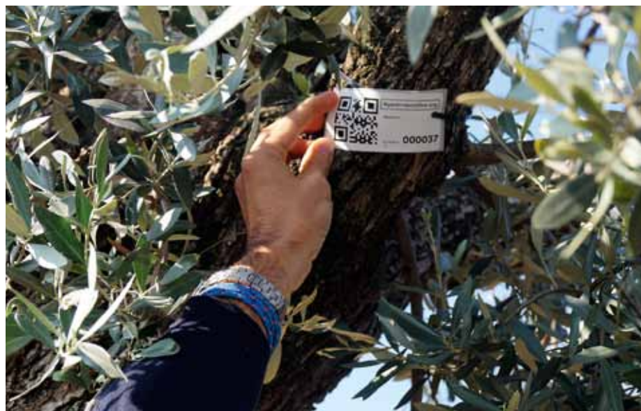
Cada olivo está etiquetado y tiene asignado un número y un código QR.

El proyecto, que se puso en marcha el pasado mes de junio, cuenta con el apoyo de varias instituciones, entre ellas el Ministerio de Agricultura a través de la Subdirección General del Aceite de Oliva, el Gobierno de Aragón, la Diputación de Teruel, la Comarca Andorra-Sierra de Arcos y el Ayuntamiento de Oliete.