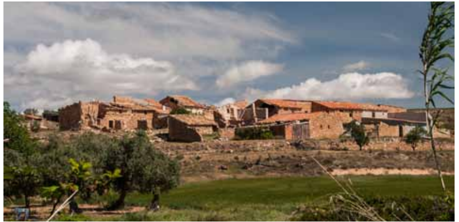
Val de Bellido

La distribución del mas era la siguiente: “En la planta baja estaba el patio y seguido, la cocina con el fogón y una cama grande de obra, donde se ponían los colchones de lana donde dormían los padres. Del patio se pasaba a una habitación con dos camas, el cuartico, para los chicos. No había puertas, había toldos de separación. En la primera planta estaban los graneros, donde se colgaban las piezas del mondongo (se mataban dos o tres cerdos para todo el año) y se establecían espacios para las patatas, las cebollas, las manzanas... extendidas o en cestas. En el granero, que daba a la era, se guardaba el grano. Y en la planta baja, subterránea, estaba la bodega, picada en la