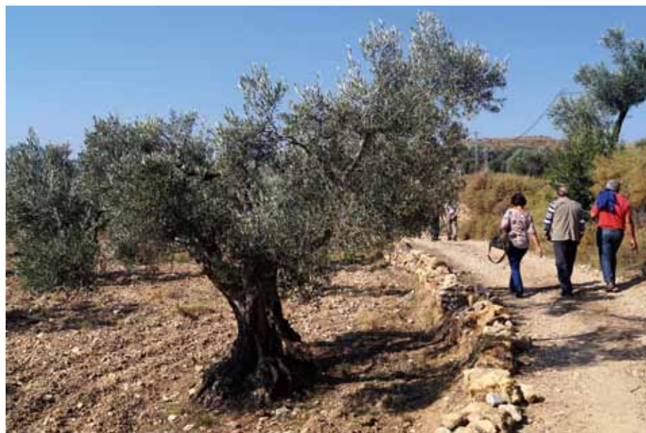
Caminos y muretes también son recuperados.