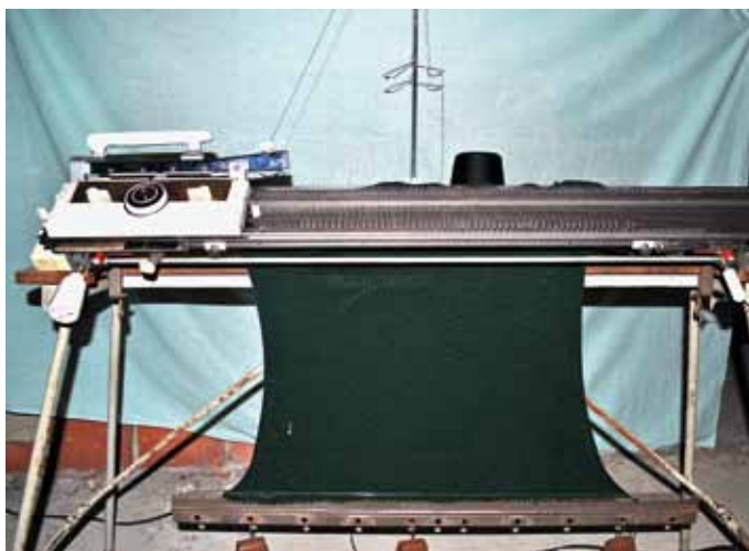
Tejedora doble