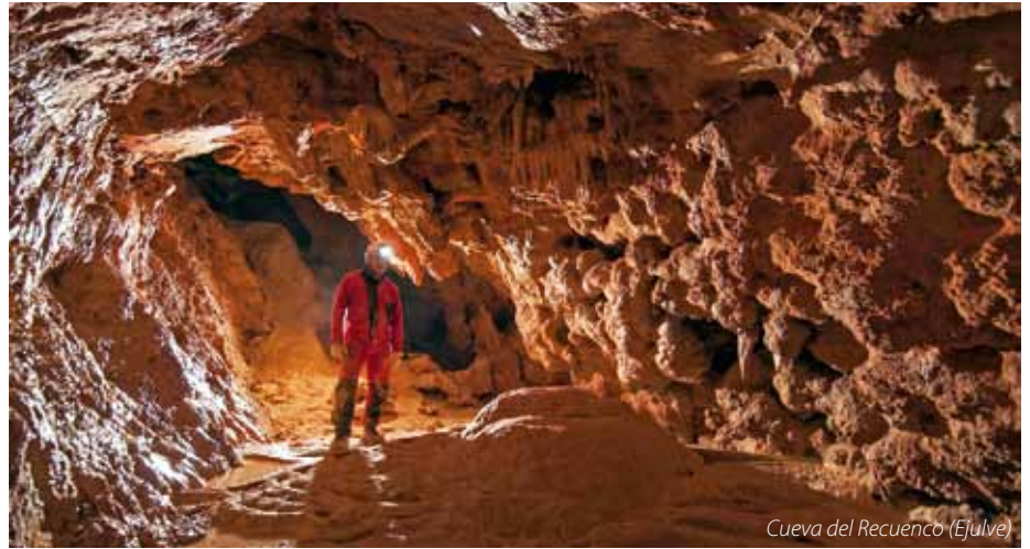
Cueva del Recuenco (Ejulve)