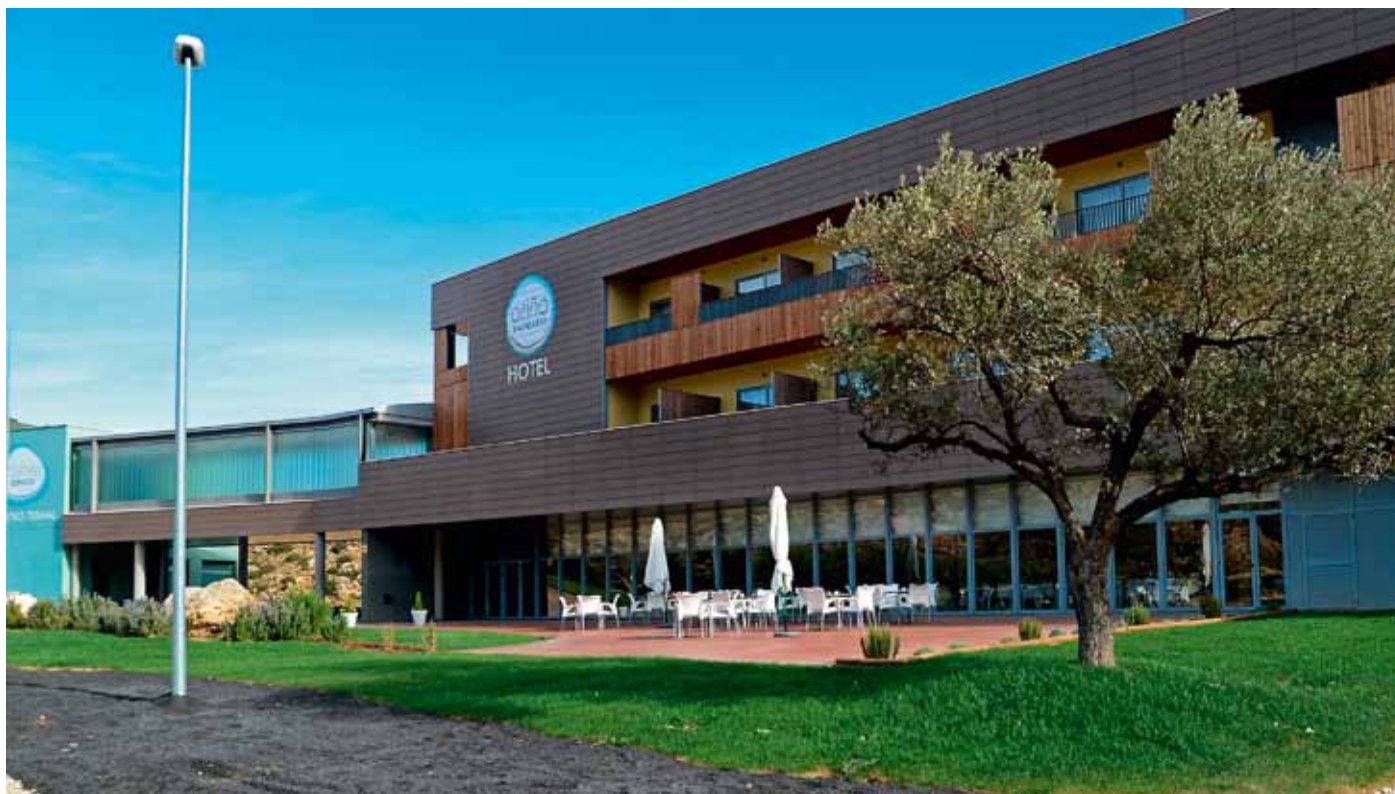
Módulo del hotel y terraza

al paisaje y al paisanaje que, junto con la conexión con Zaragoza, ofrece un conjunto amplio de posibilidades, el cliente tiene argumentos suficientes para descubrir una zona nueva y singular.