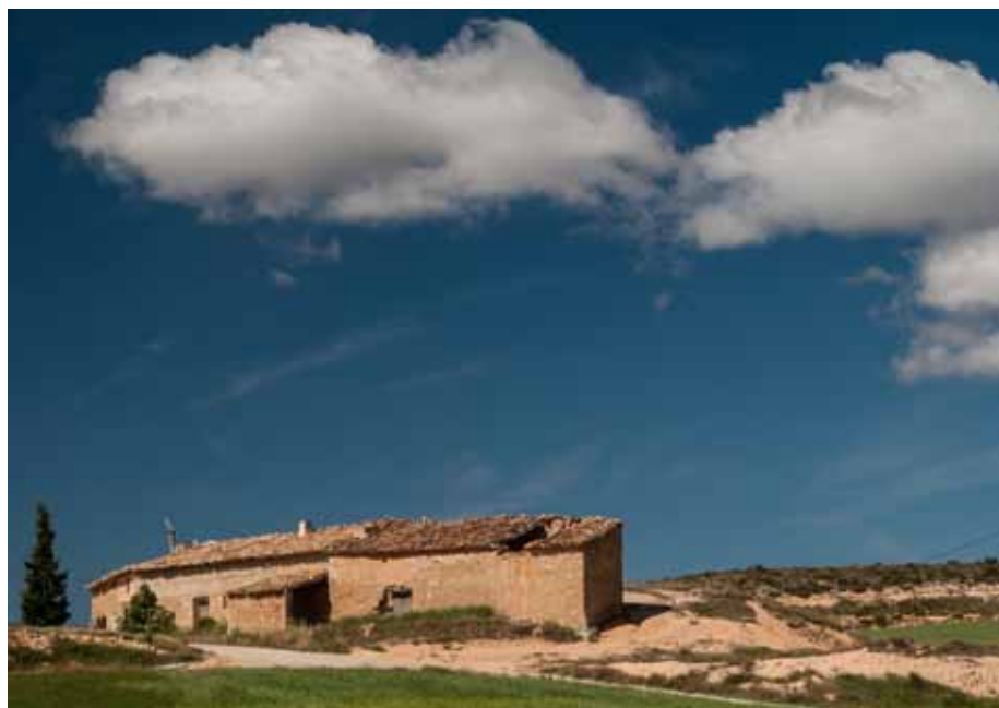
Ifesa de abajo

Nos comentan que para las fiestas se iba al pueblo, porque se había terminado la cosecha: "Había dos bailes con música, El Almudín y El Trinquete. Cuando