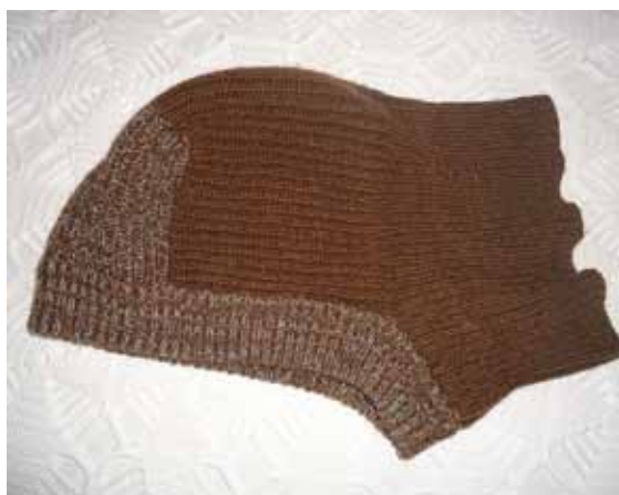
De izq. a dcha. jersey realizado con una tricotosa. Medias de baturra. Gorro