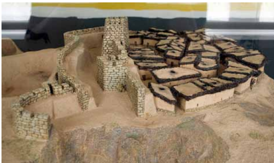
Maqueta del poblado ibero de San Pedro

El cabezo de San Pedro fue descubierto en 1880 por C. Gomis y las únicas excavaciones arqueológicas son las que llevó a cabo el Museo de Teruel en 1981 y 1983. Está diferenciado en dos zonas, la primera es el recinto fortificado, que aprovecha las condiciones del terreno al situarse al extremo del cerro, protegido por un cortado y con medidas defensivas monumentales por el otro lado: un gran foso, doble línea de murallas -la primera de cuatro metros de anchura-, un camino de ronda y varios torreones de planta circular y cuadrangular, de los cuales uno conserva una altura de más de trece metros. Esta fortificación, como se explica en el centro, desempe-