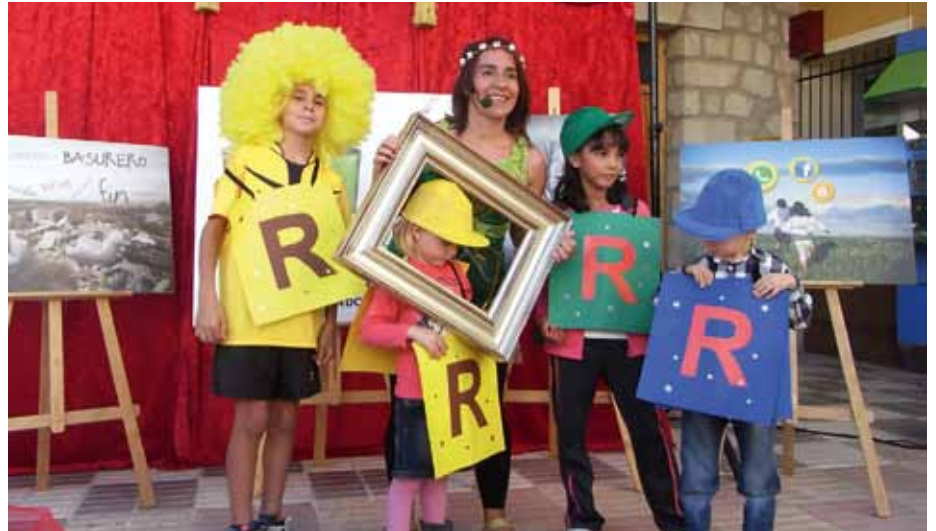
El público participó activamente en el desarrollo del cuentacuentos.