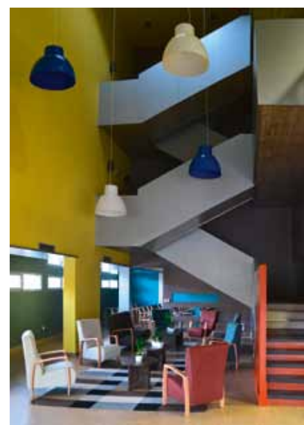
Vestíbulo y escalera de acceso a las habitaciones

En su estrategia para desarrollar algún tratamiento que caracterice al destino están estudiando la posibilidad de utilizar la turba en alguno de los tratamientos. La turba se madura en las aguas termales y luego se aplica sobre la piel del paciente por diversos métodos. Este es un producto que mantiene muy bien sus propiedades, que facilita que los minerales penetren en la piel y que tiene efecto peeling . Se utiliza mucho en el centro de Europa.