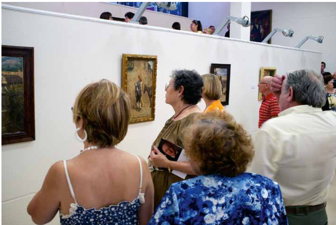
Numerozo público se congregó el día de la inauguración en Crivillén.

a la que nunca renunció, como así lo expresaba en los periódicos de la época de su residencia en Madrid. Por el contrario, Gárate también desarrolló una gran diversidad de temas, como queda demostrado en este legado. Así, veremos temas paisajísticos, arquitectónicos, de retratos, costumbristas, etc. de otras tierras y que fue recogiendo en su paso por diversas estancias en el extranjero, tanto en Italia, desde 1890 a 1895 (Roma, Pisa, Venecia, San Francisco de Asís... ) como en París o Berlín.