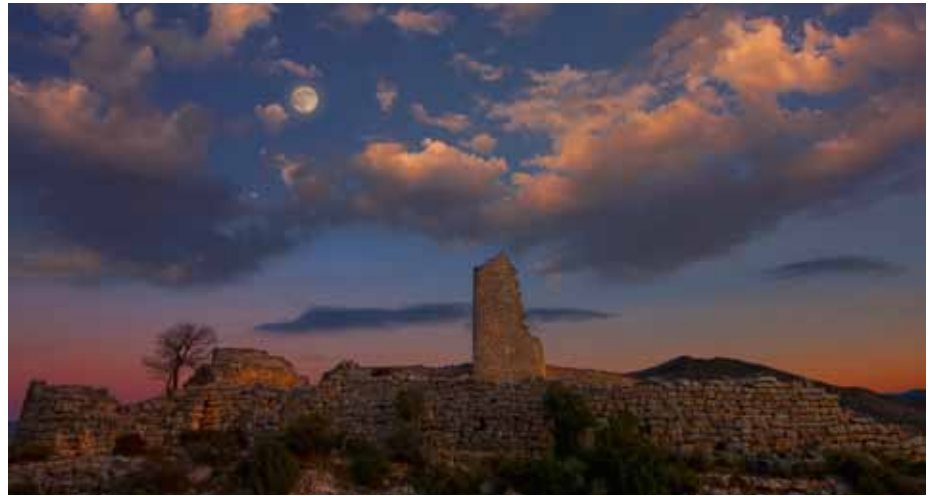
Atardece en el poblado de San Pedro (Oliete). José Francisco López Martín (Zaragoza). Primer premio del I Concurso de Fotografía Iberos en el Bajo Aragón (2013), convocado por el Consorcio Patrimonio Ibérico de Aragón.

Depósito Legal TE-84-2012 ISSN 2254-9188