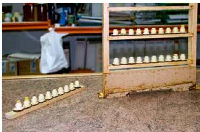
Artilugio para recolectar la jalea real.