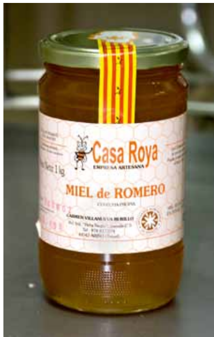
Miel de romero envasada en Apícola LEVI

El propóleo: Es una sustancia pegajosa que producen las abejas partiendo de resinas de las plantas (flores y yemas de los árboles). Introducen las sustancias en su boca y las transportan a la colmena. Es el material de sellado con el que recubren el interior del panal, reparan las celdas, reducen el tamaño de las entradas de la colmena y cubren las sustancias extrañas que no pueden transportar al exterior.