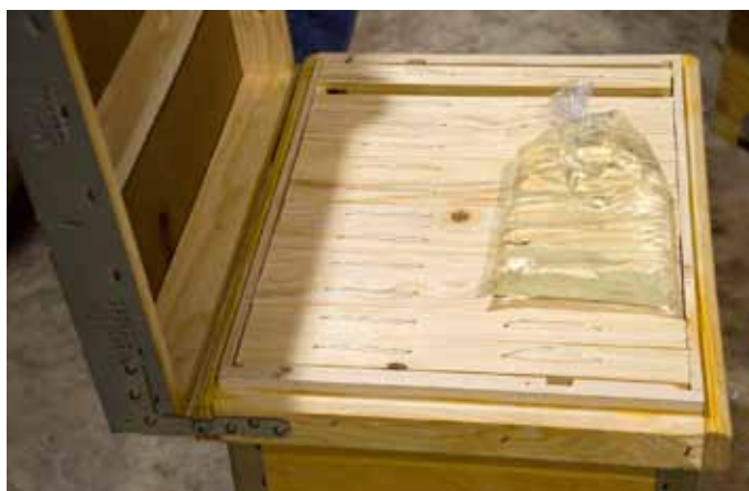
Bolsa de azúcar mezclado con agua.

La ilusión de Apícola LEVI es abrir mercados para la venta de nuestros productos ya que tenemos una excelente calidad sin tener que envidiar ninguna miel de todo el mundo. El carné de artesanía alimentaria nos avala.