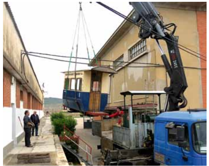
Momento en el que vagón y locomotora se descargan en el pozo de San Juan procedentes de Benicassim.

El propósito es que para la primavera de 2015 el “Ferrocarril minero Pozo de San Juan” esté funcionando ya con pasajeros, pero, por ser una fecha muy especial para el museo y la asociación, se ha elegido el día de Santa Bárbara para la puesta en vía de la locomotora y el tren y para realizar un recorrido de exhibición.