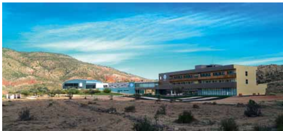
Vista general de las instalaciones

Fue en el año 2002 cuando empezó a gestarse este proyecto con unas jornadas de promoción organizadas desde la Agencia de Desarrollo Local de la Mancomunidad Sierra de Arcos con el apoyo del Ayuntamiento de Ariño y del Parque Cultural del Río Martín. Tras la celebración de estas jornadas el Ayuntamiento de Ariño encargó varios estudios e informes (una evaluación actualizada de la caracterización farmacodinámica y clínica de las aguas, un estudio de viabilidad y marketing , un peritaje para establecer el perímetro de protección y el lugar más adecuado de captación de las aguas...) con el fin de tener la máxima información posible a la hora de iniciar una futura inversión. Al mismo tiempo, se realizaron los primeros trámites administrativos y legales