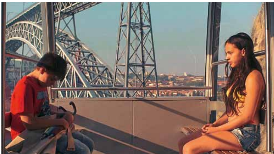
Funicular (fotograma de la película)

Este cortometraje, rodado en portugués, cuenta la historia de un grupo de jóvenes de Oporto que juegan, en sus ratos libres, a saltar al río Duero desde el puente Don Luis, a una altura de más de 15 metros.