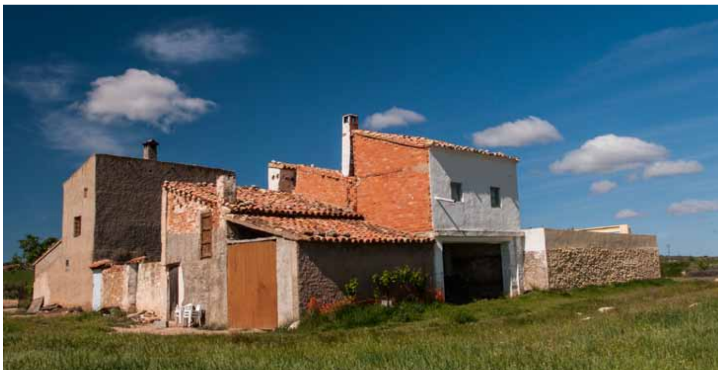
Val de Cabrón

familias en las que la muerte del padre o una desgracia económica hacía difícil que salieran adelante. Los únicos problemas entre ellos que nos nombra son los relacionados con las aguas, problemas de uso de riego, por ejemplo.