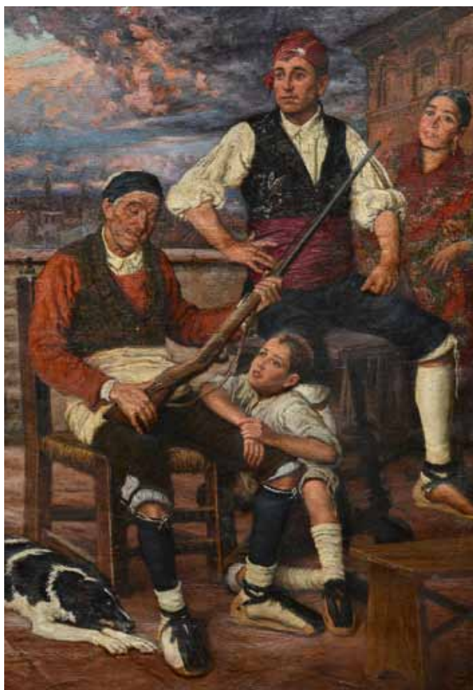
La reliquia gloriosa, 1927, óleo.