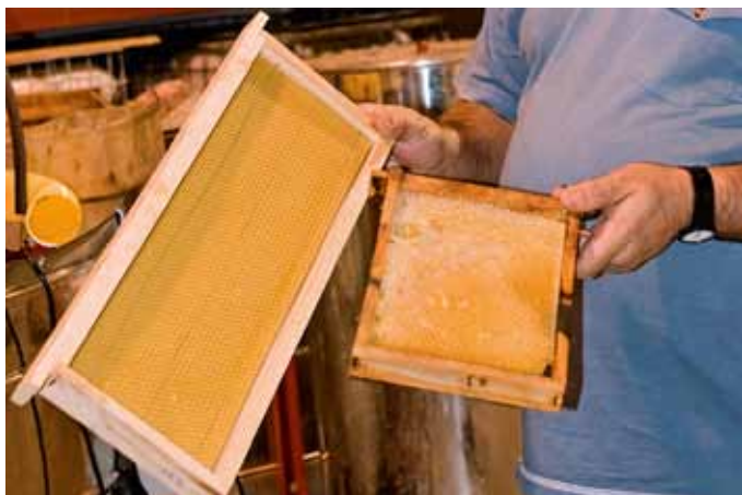
Cuadros para favorecer la cimentación