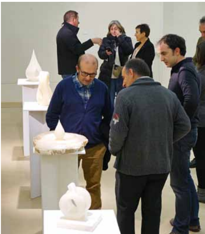
Los asistentes a la inauguración contemplaron con mucho interés las obras expuestas.

En la exposición, que ha estado abierta durante un mes, se han podido ver unas 70 esculturas en alabastro, convirtiéndose con casi toda seguridad en la exposición exclusivamente de alabastro más importante que se haya presentado nunca, por número y calidad de las piezas expuestas. Con el hilo conductor de la belleza de la materia prima con la que se ha trabajado hemos podido disfrutar de piezas muy distintas, desde las más conceptuales y abstractas hasta las más figurativas.